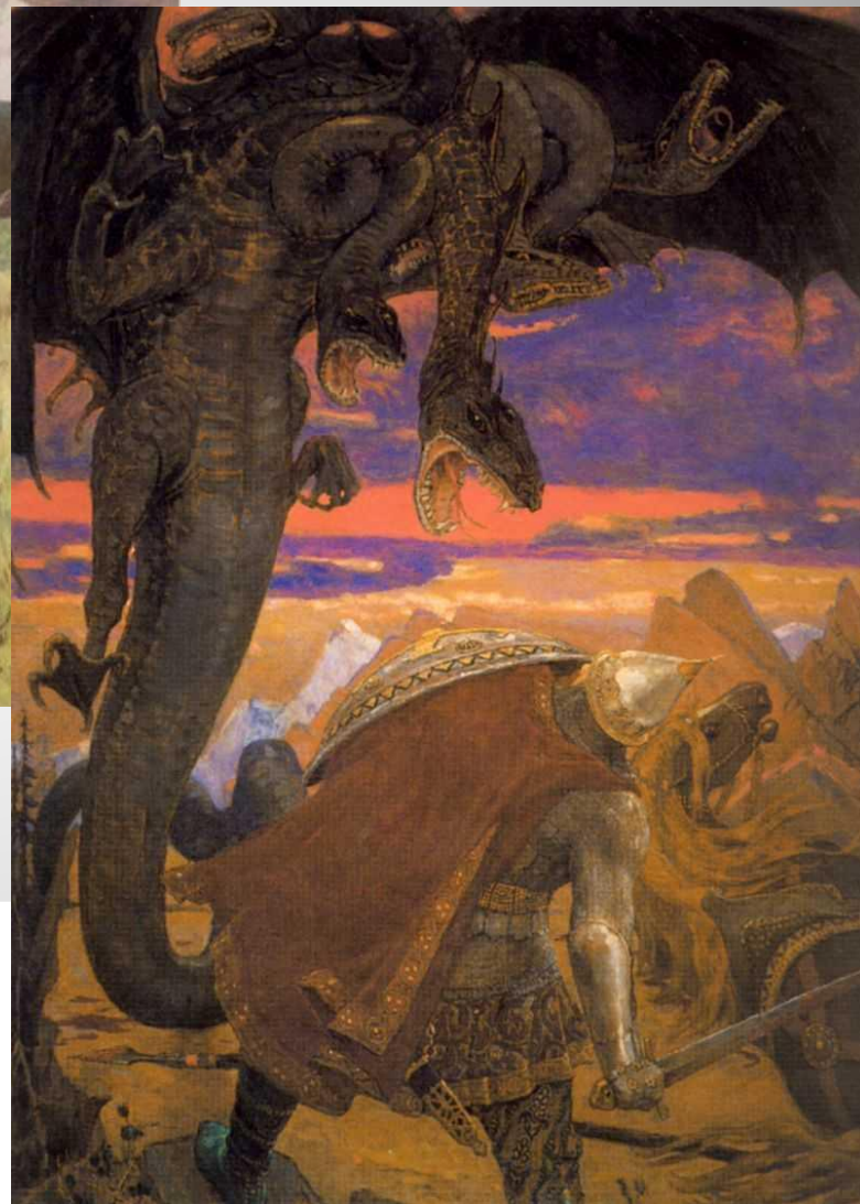
Битва со змеем