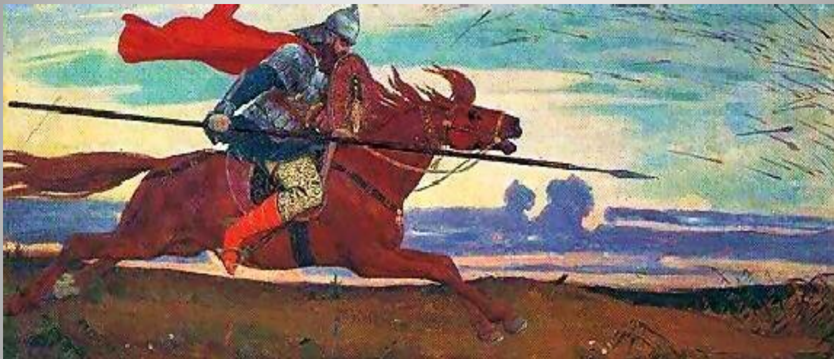
Один в поле воин