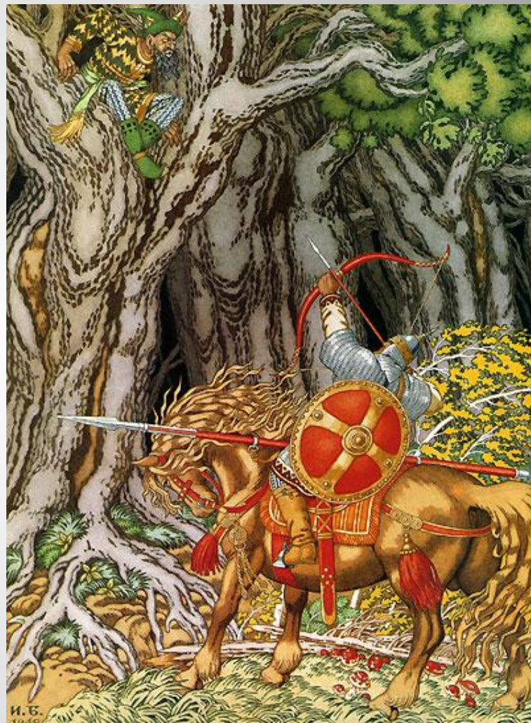
Илья Муромец и соловей-разбойник