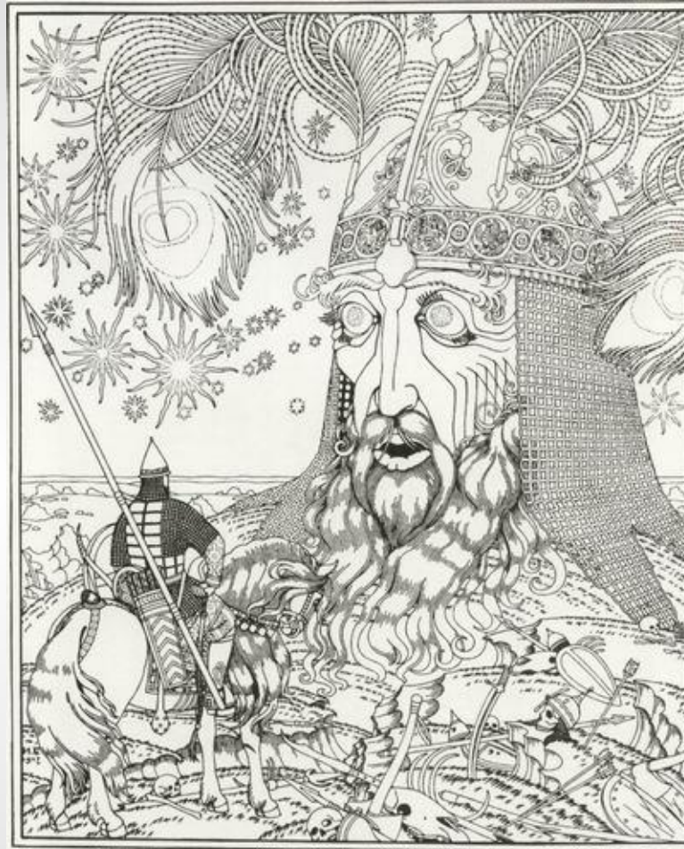
Руслан и Людмила