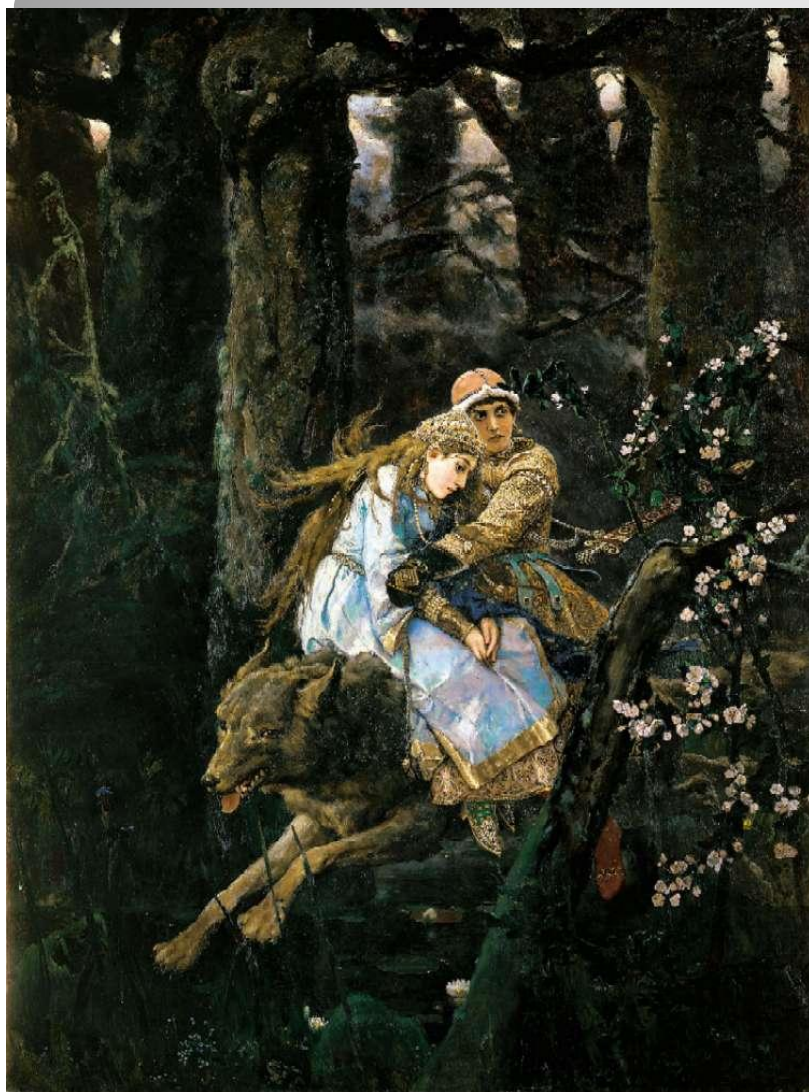
Иван-царевич на сером волке