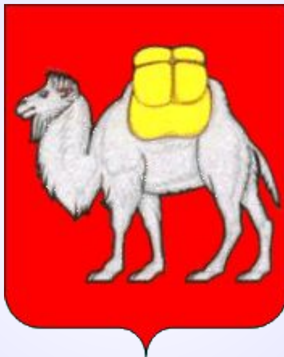
Герб Челябинской области