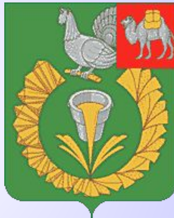
Современный герб г. Верхнего Уфалея