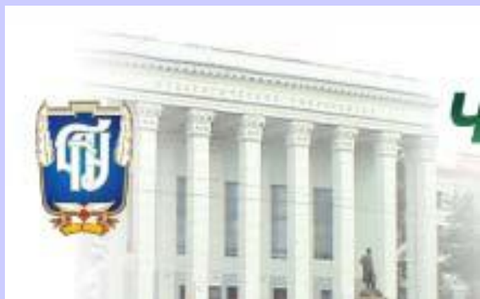
ЧЕЛЯБИНСКИЙ ГОСУДАРСТВЕННЫЙ ПЕДАГОГИЧЕСКИЙ УНИВЕРСИТЕТ