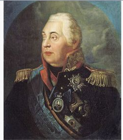
Портрет М. И. Кутузова кисти Р. М. Волкова