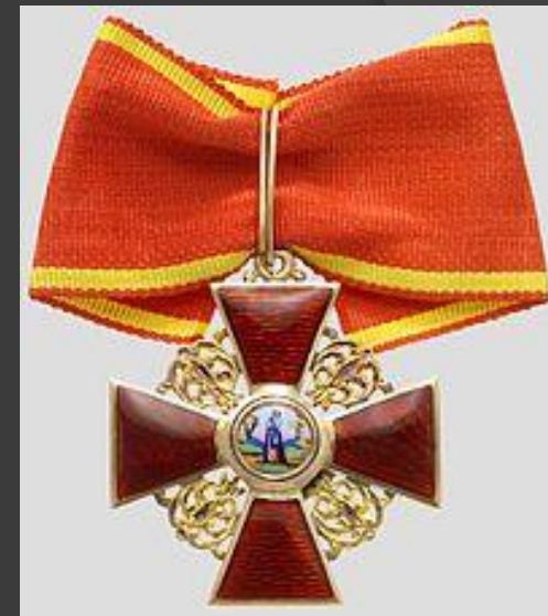
Орден Святой Анны