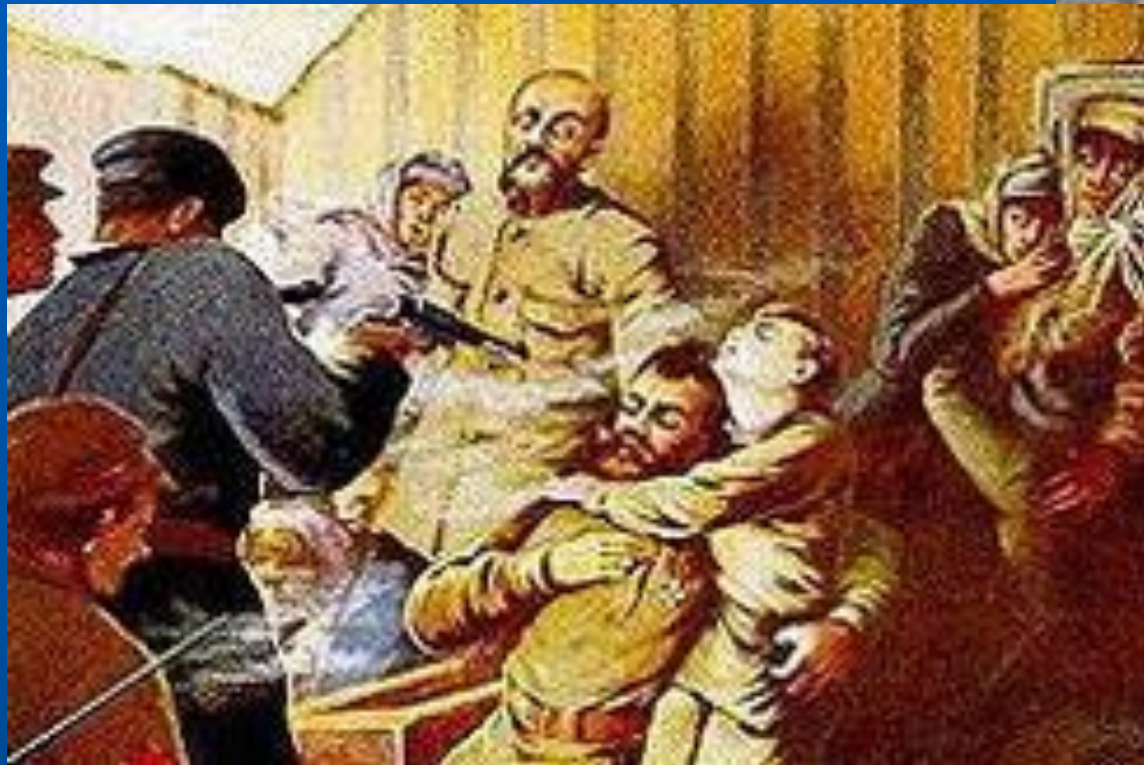
Яков Юровский начальник ЧК