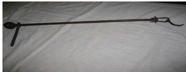
Безмен – весы.

На Руси для глажения белья использовали «утюг» - рубель, а позже литые чугунные утюги.