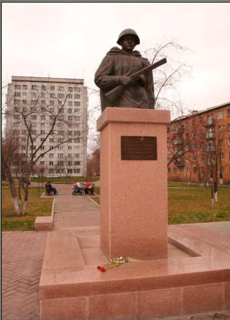
Герою СССР Александру Матросову.