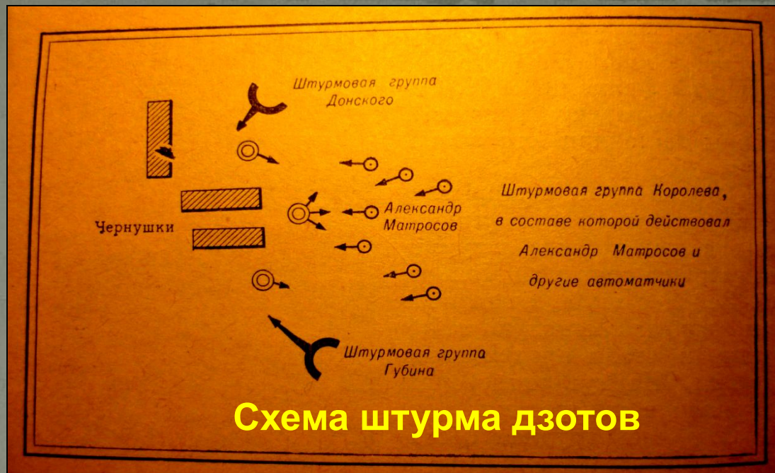
Схема штурма дзотов

В атаку шла бесстрашных рота, И дрогнул вражеский отряд, Но вдруг из черной щели дзота Посыпался свинцовый град.