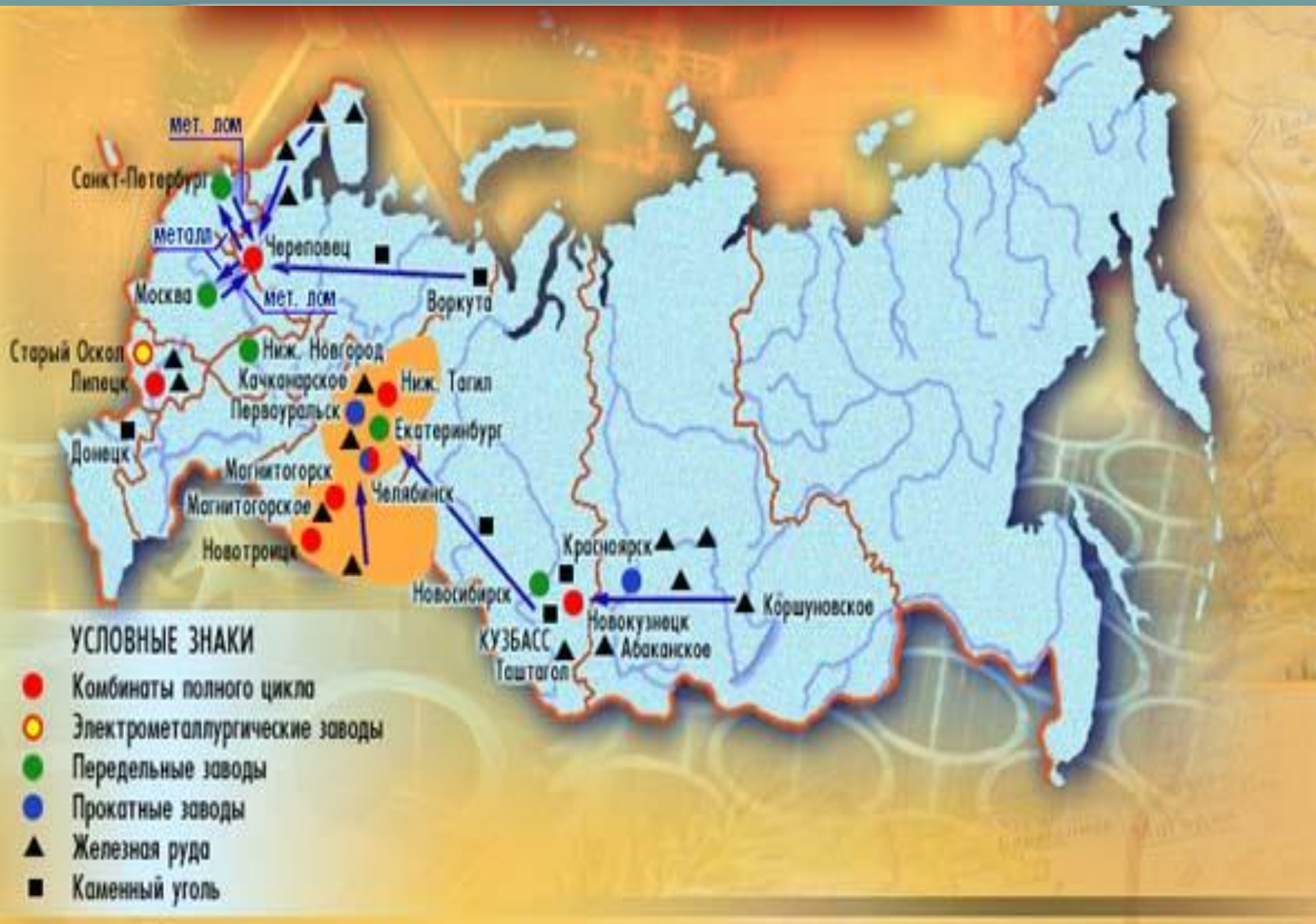
География черной металлургии России