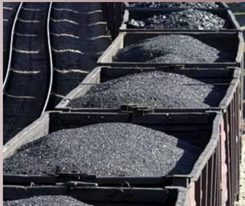
Перевозка угля по железной дороге