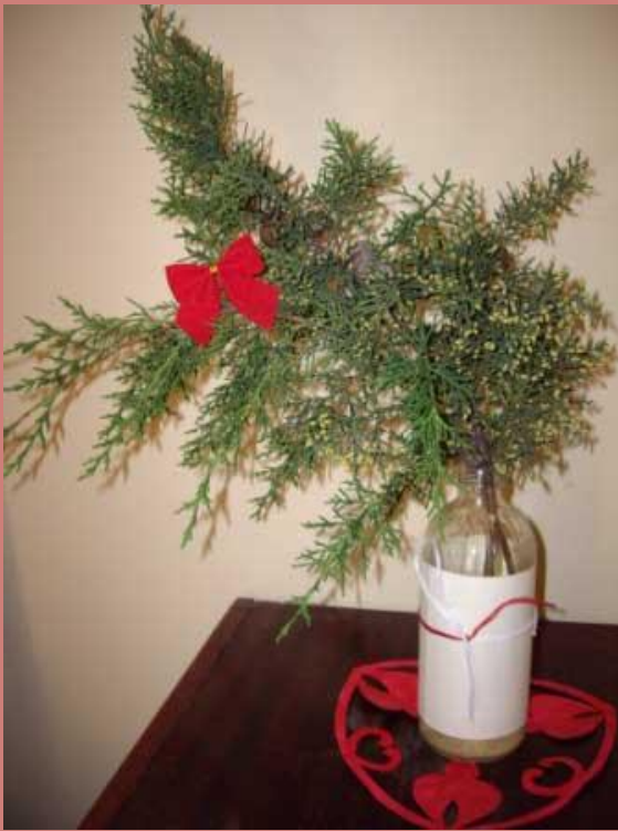
Икебана «Новогодняя» с элементами оригами

Мне очень нравится заниматься икебаной, потому что это успокаивает и умиротворяет, а также развивает фантазию. С тех пор как я начала увлекаться этим видом искусства, я стала ближе к природе, тем самым «понимая» растения, их жизнь.