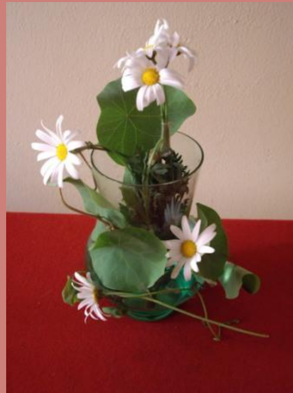
Композиция «Случайное цветение»