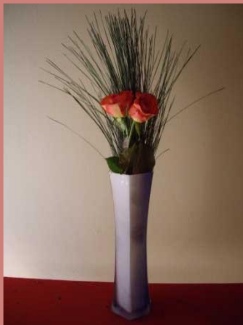
Роза и сосна – символ долголетия