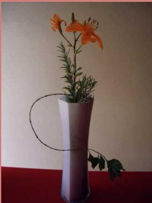
Композиция «Рождение весны»