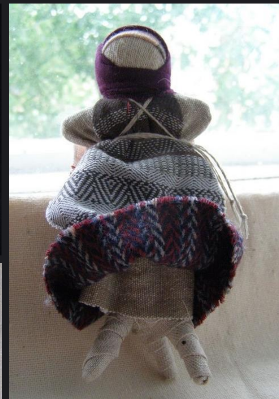
Удмуртская кукла ТРЕНОГА