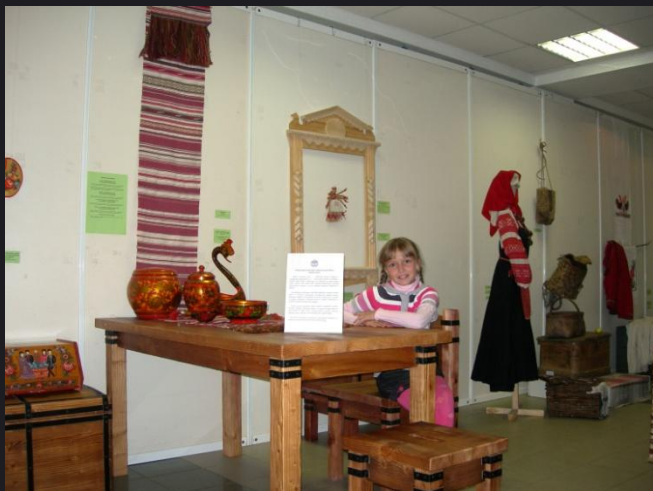
ВЦ Галерея г.Ижевск «Дары Сварога»