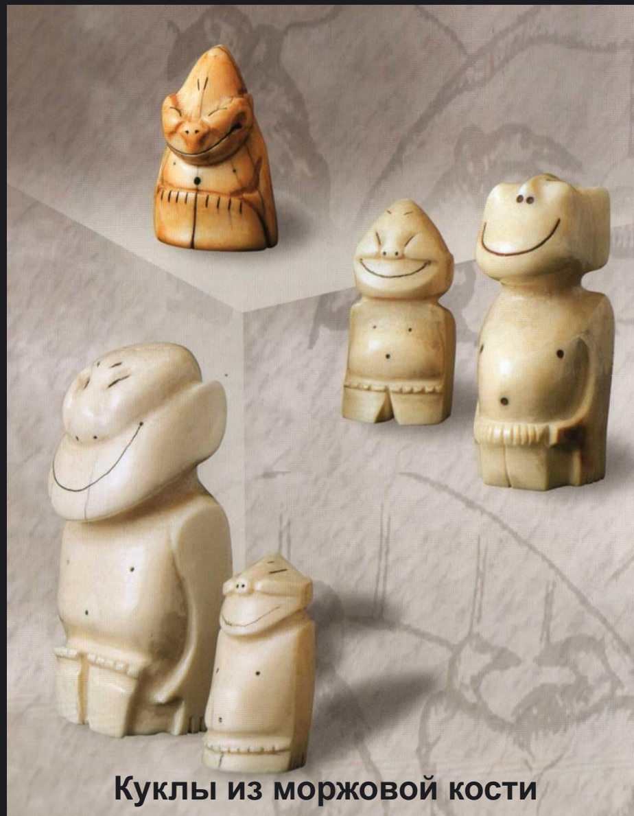
Куклы из моржовой кости