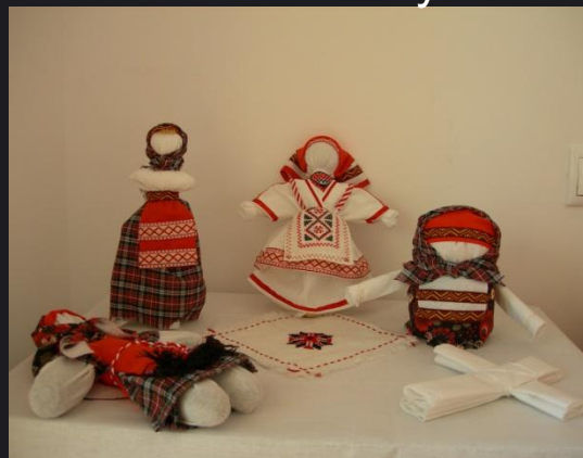
Стенд «Куклы Удмуртии»