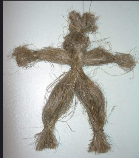
Кукла из льна