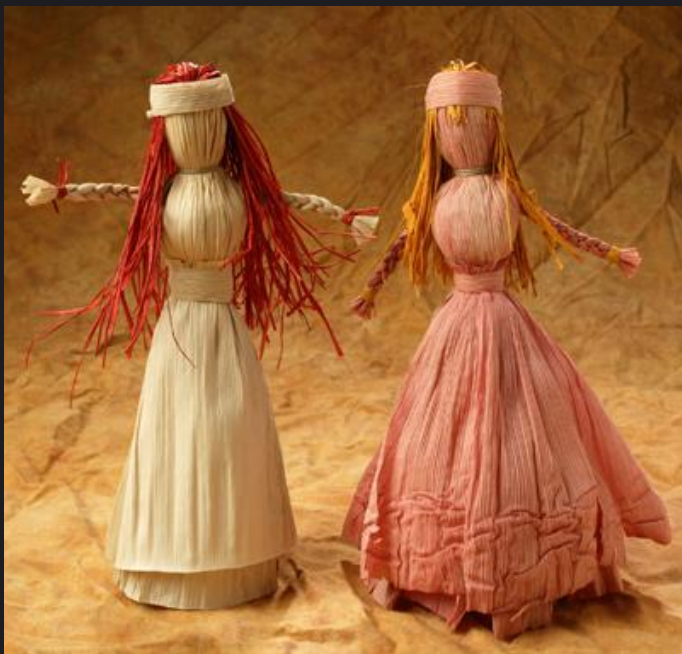
Куклы из кукурузы