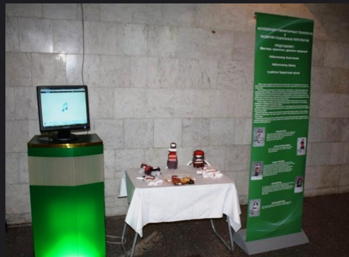
Усть-Илимск, Иркутская область. Выставка «Кукла-любимая игрушка»