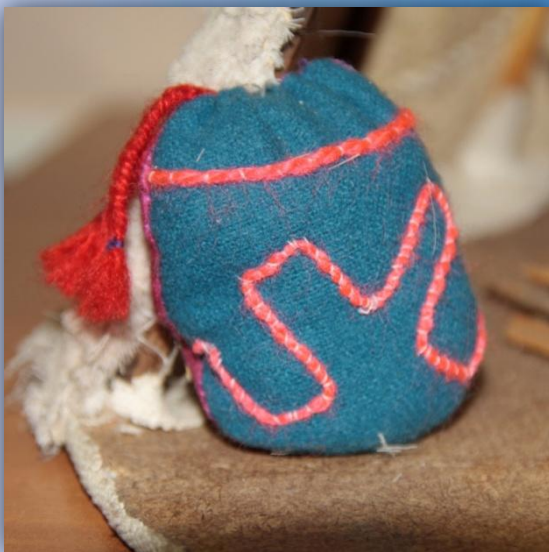
Женская сумка для хранения вещей. Экспонат ГУ «ЯНОМВК им. И. С. Шемановского»