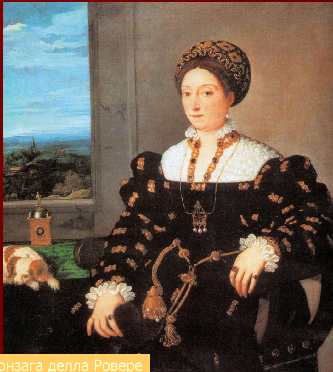
Тициан. Портрет Элеоноры Гонзага делла Ровере

В начале XIX века начинается царство кринолинов и корсетов. Самый ужасный утягивал талию и бедра и весил несколько килограммов. Конная прогулка иногда заканчивалась для дам, утягивавших талию до 55 см, летальным исходом. Врачи били тревогу, особенно после изобретения рентгеновского аппарата.