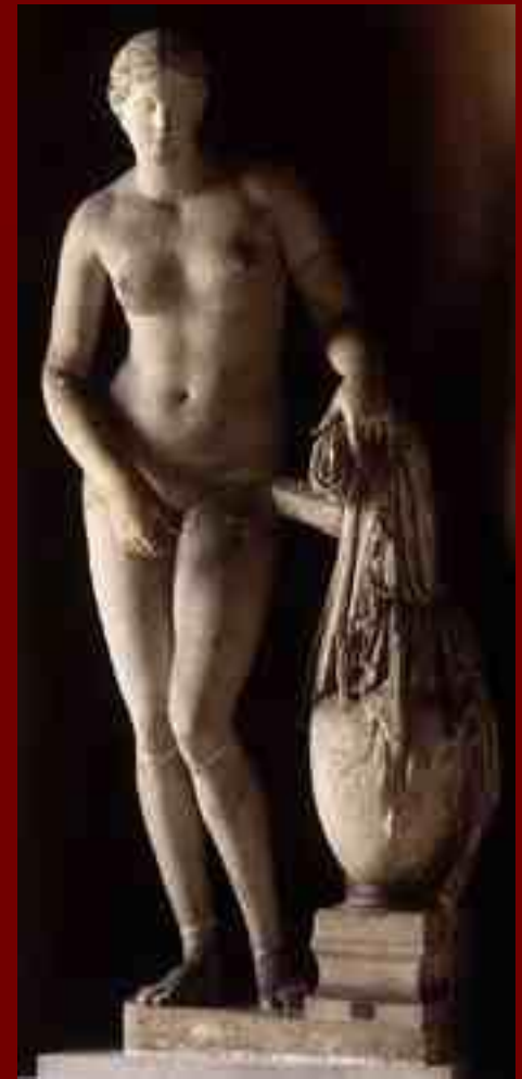
Афродита Книдская Пракситель 4 в. до н.э.

Так, Афродита имеет рост 164 см, окружность талин - 69 см, груди - 86 см, бедер - 93 см.