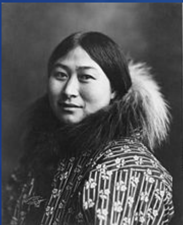
Эскимосская женщина, 1907 г.

По данным Переписи населения 2002 года численность эскимосов, проживающих на территории России, составляет 19 тысяч человек.