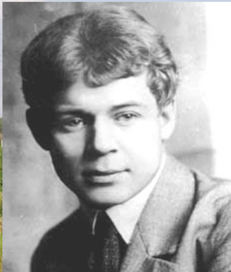
Есенин Сергей Александрович