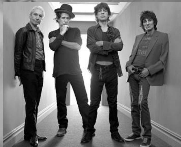
Яркие представители битников – Rolling Stones