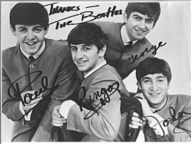
Одна из самых известных рок-групп мира, основоположники рок-музыки - The Beatles

Накануне того, как в Англию по разным каналам начал проникать рок-н-ролл, молодёжной среде были известны две группировки - «тэдди бойз» и «битники».