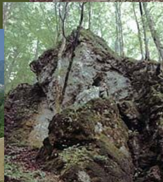
Карпатский заповедник. Горный лес.