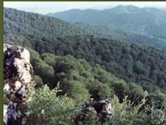
Карпатский заповедник. Склоны гор