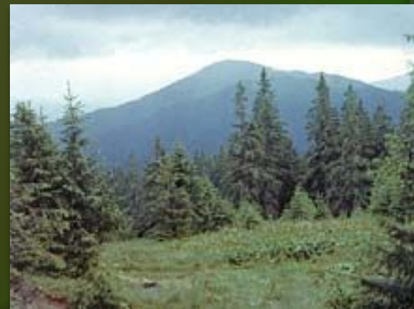
Карпатский заповедник. Панорама.