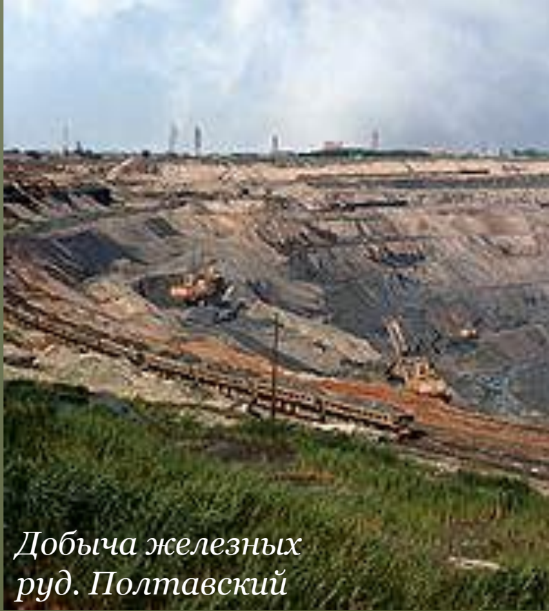
Добыча железных руд. Полтавский горно-обогатительный комбинат.