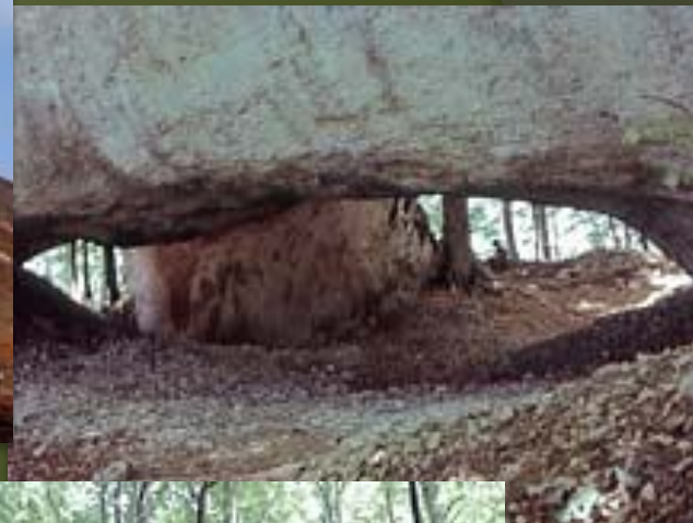
Карпатский заповедник. Каменные ворота.