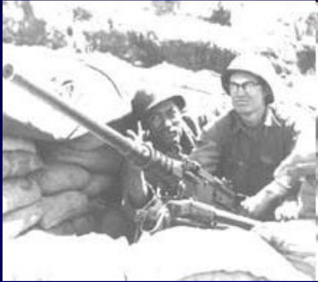
Американские солдаты в Корее