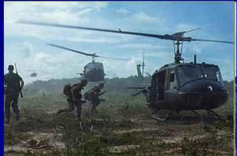
Армия США а Юж.Вьетнаме