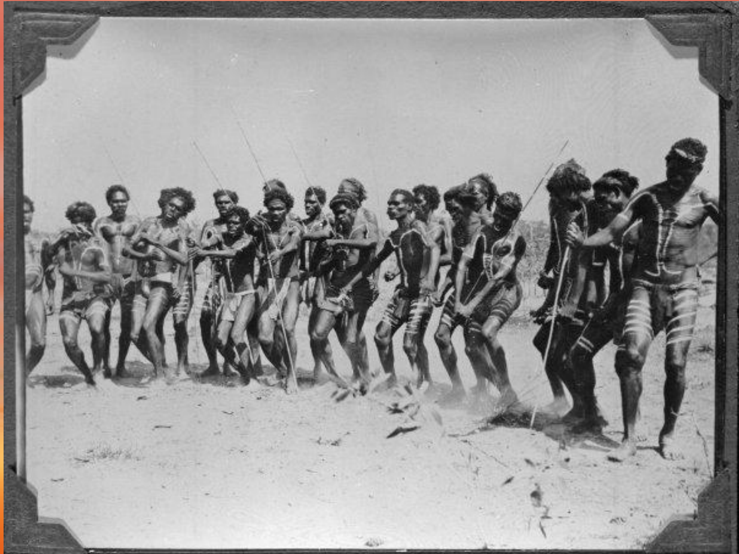
A Native Dance