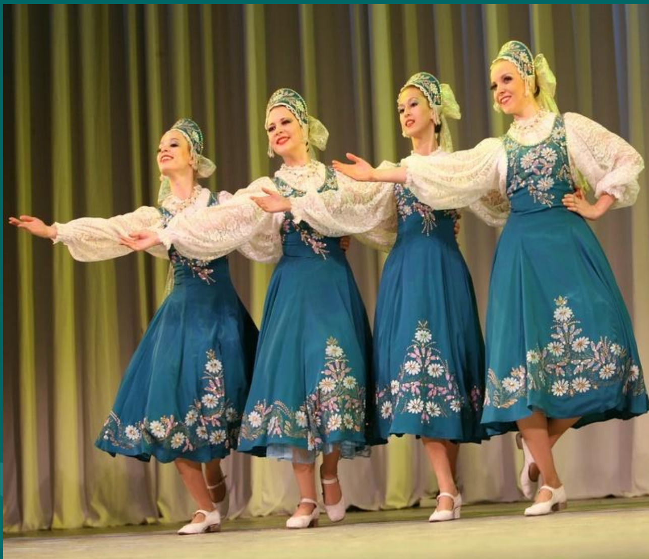
Русский народный танец