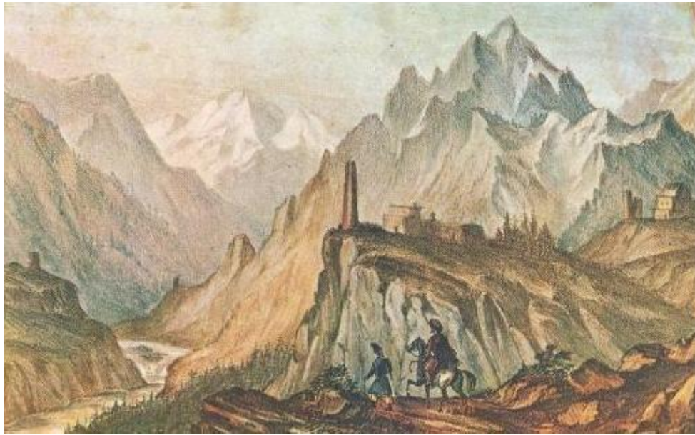
Вид Крестовой горы.

«Как перевалился через хребет в Грузию, так бросил тележку и стал ездить верхом; лазил на снеговую гору (Крестовая) на самый верх, что не совсем легко: оттуда видна половина Грузии на блюдечке <...> для меня горный воздух – бальзам; хандра к черту, сердце бьется, грудт высоко дышит – ничего не надо в эту минуту; так сидел бы да смотрел целую жизнь».