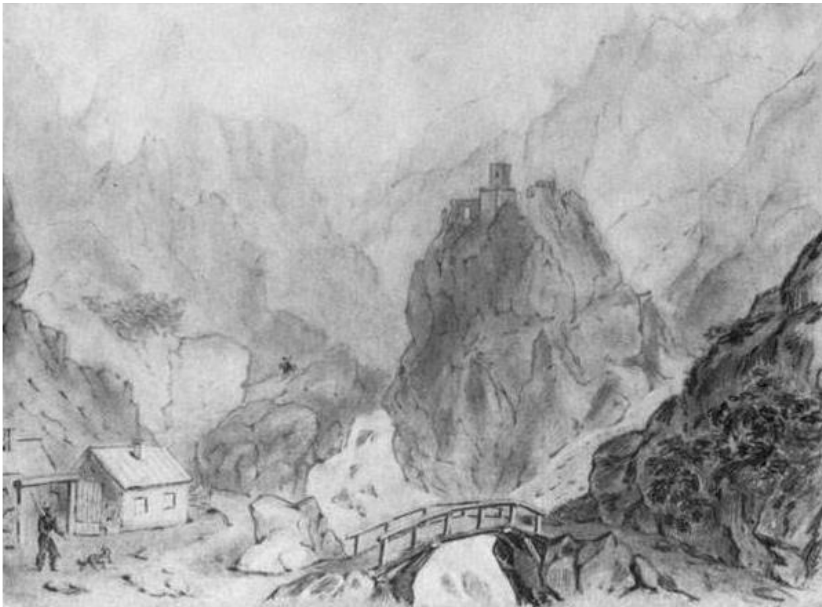
Дарьяльское ущелье с замком царицы Тамары. Карандаш. 1837