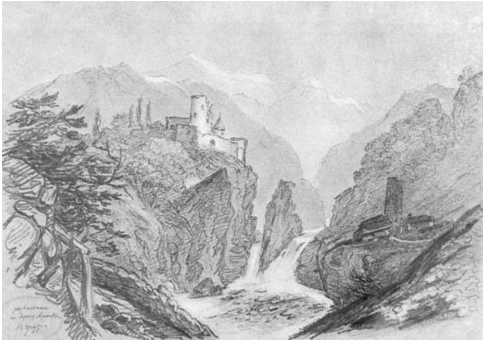
Развалины на берегу Арагвы и Куры. Карандаш. 1837