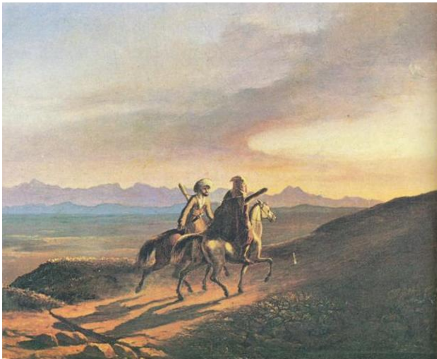
Воспоминания о Кавказе. Масло. 1838