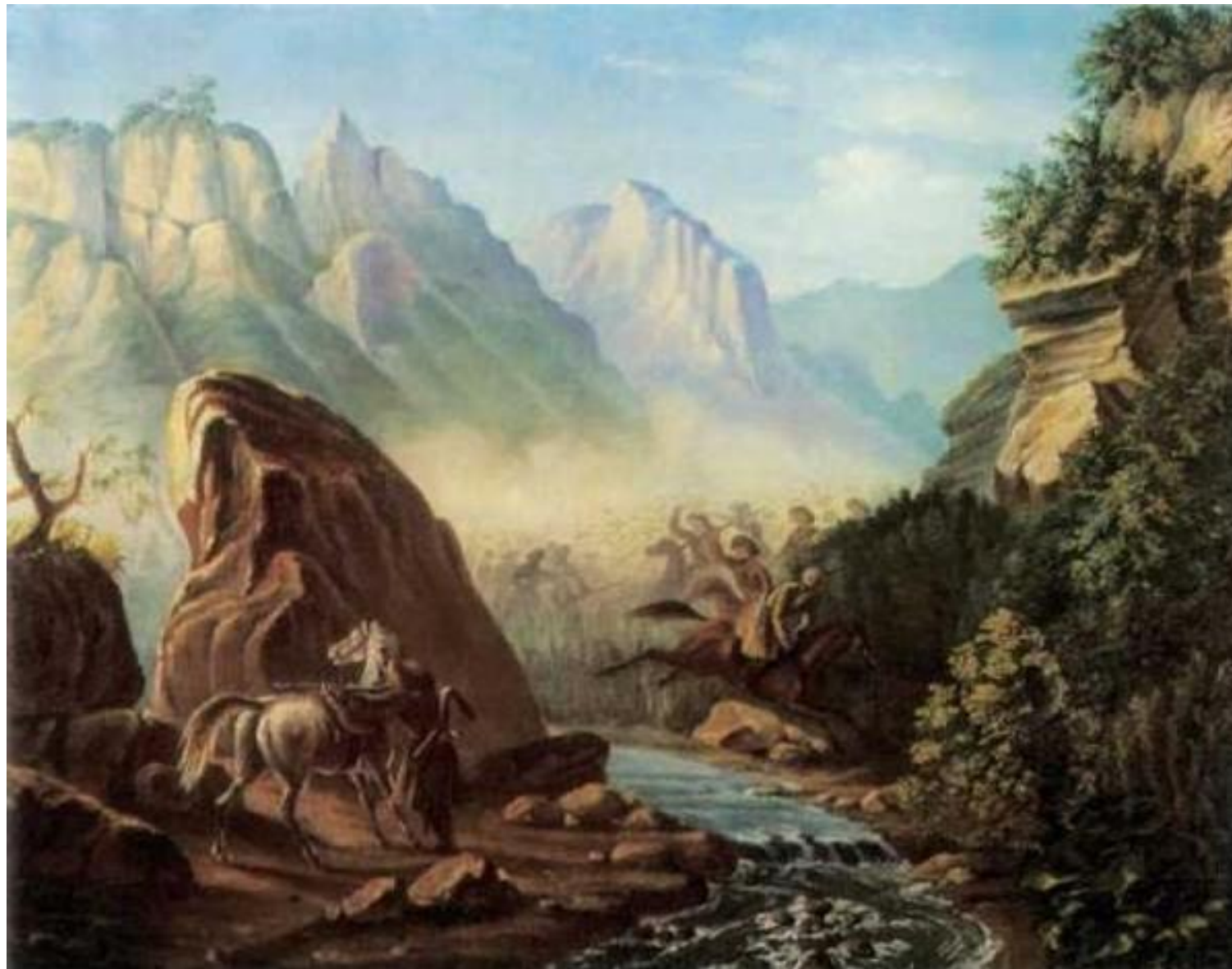
Перестрелка в горах Дагестана. Масло. 1840-1841