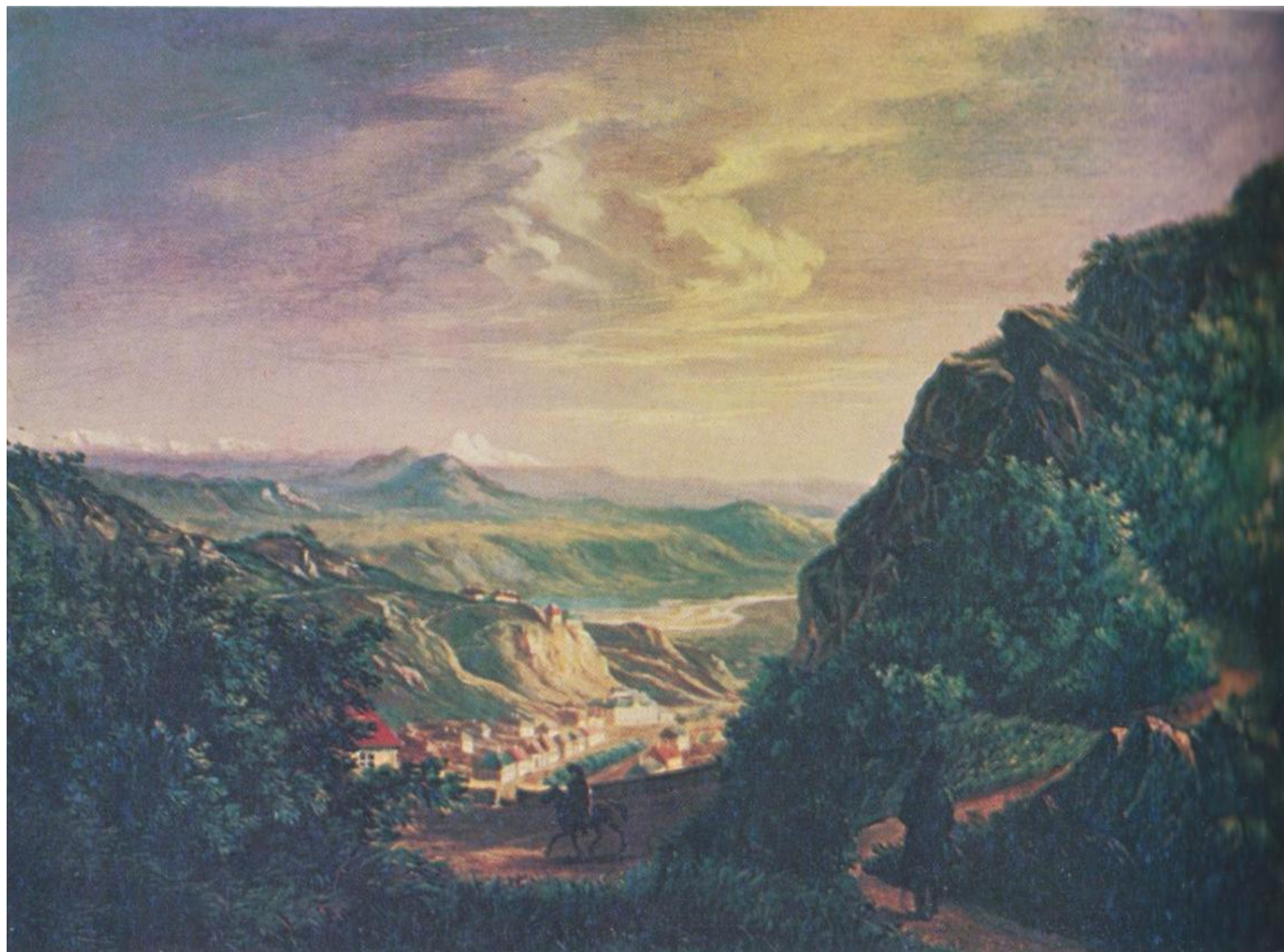
Вид Пятигорска. Масло. 1837