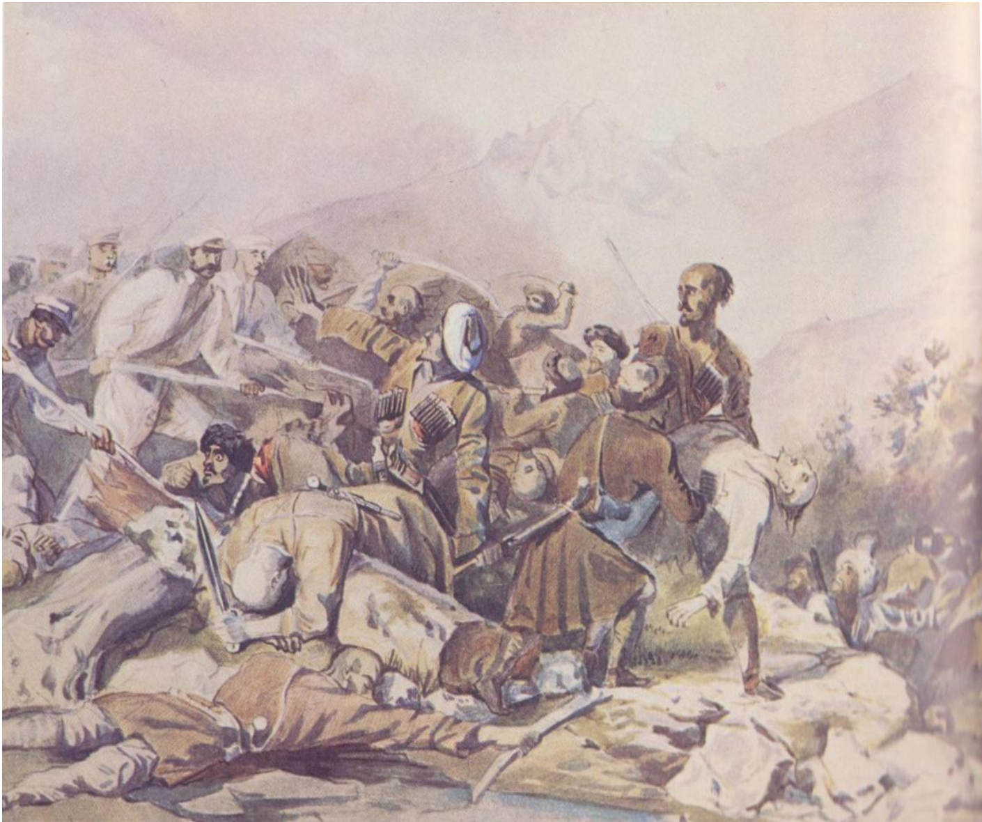
Эпизод из сражения при Валерике. Рисунок. 1840