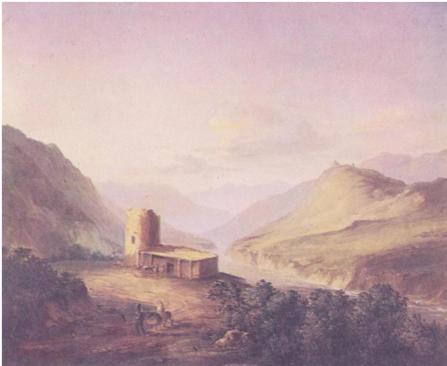
Военно-Грузинская дорога близ Мцхеты. Масло. 1837