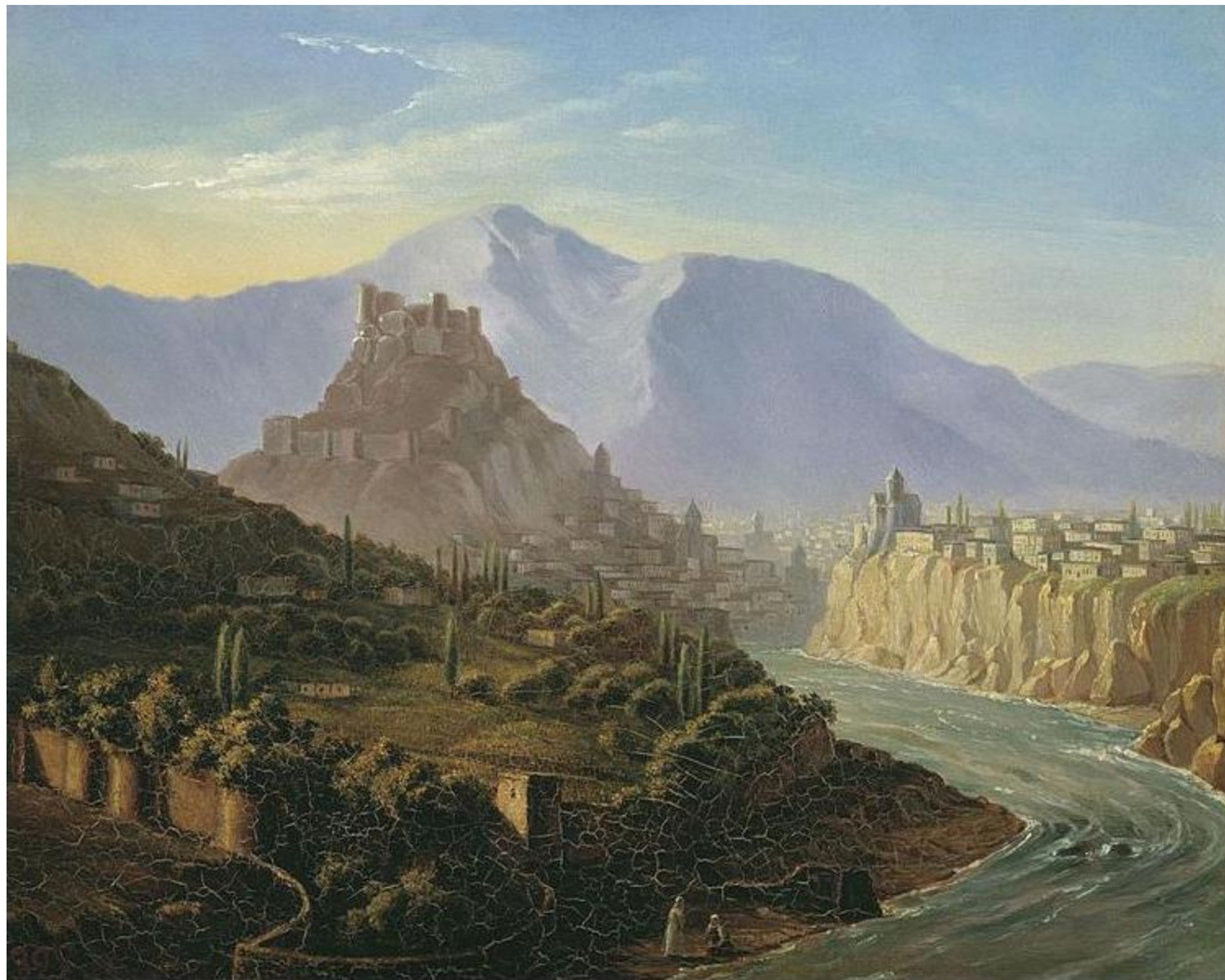
Вид Тифлиса. Масло. 1837