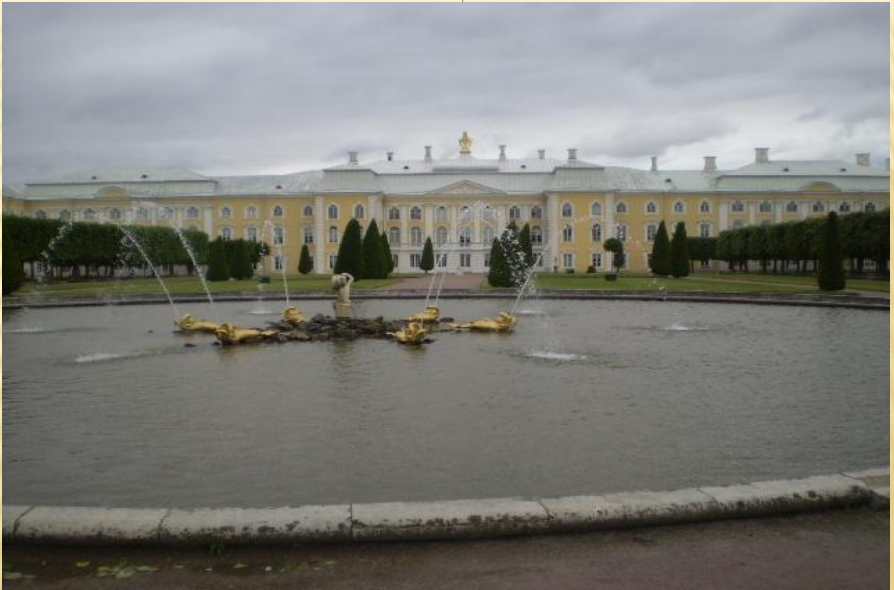
Фасад дворца Екатерины