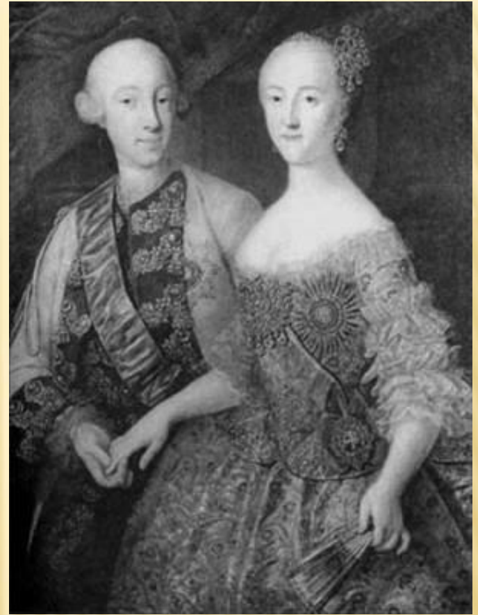
Великий князь Петр Федорович и Великая княгиня Екатерина Алексеевна