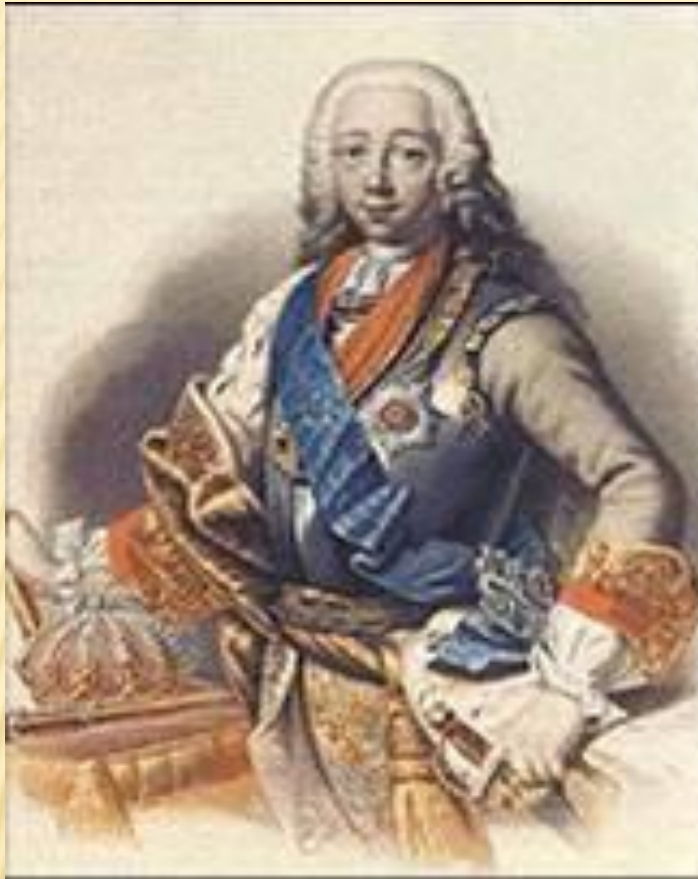
Великий князь Петр Федорович будущий император Петр III