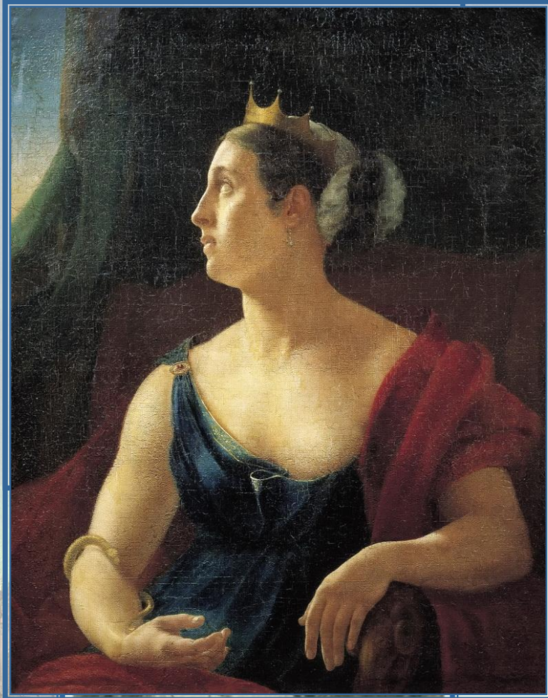
Е. С. Семенова

трагическая актриса Карл Дидло балетмейстер