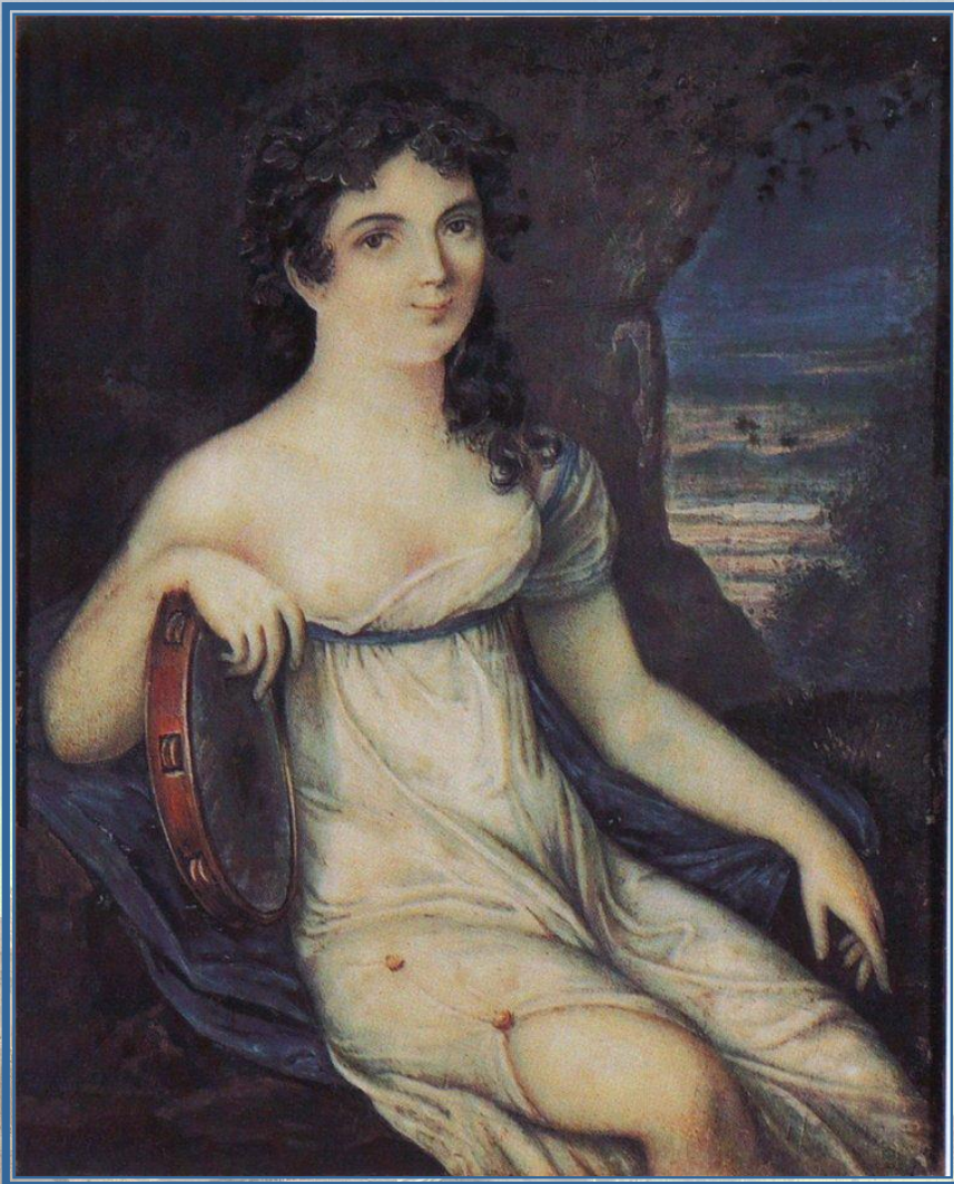
Е. И. Истомина прима балерина петербургского балета

Блистательна, полувоздушна, Смычку волшебному послушна, Толпою нимф окружена, Стоит Истомина; она, Одной ногой касаясь пола, Другую медленно кружит, И вдруг прыжок, и вдруг летит, Летит, как пух от уст Эола; То стан совет, то разовьет, И быстрой ножкой ножку бьет.