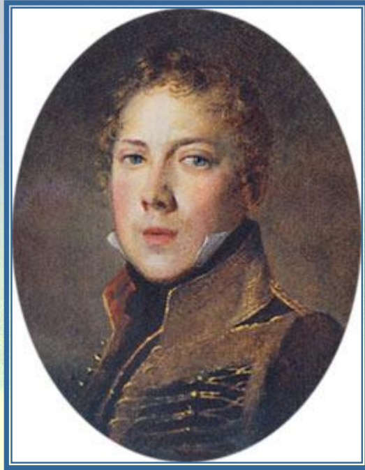
П. Я. Чаадаев

Любовь никак нейдет на ум: Увы! Моя отчизна страждет, Душа в волненьи тяжких дум Теперь одной свободы жаждет.