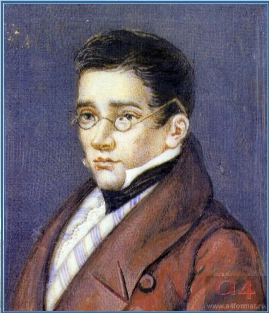
Александр Сергеевич Грибоедов