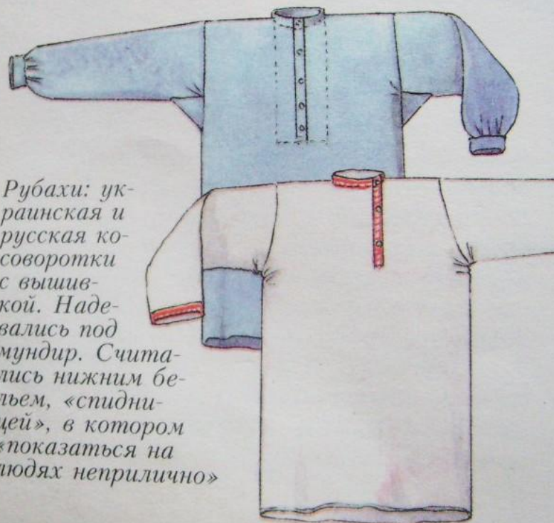
Рубахи: ук- раинская и русская ко- соворотки с вышив- кой. Наде- вались под мундир. Счита- лись нижним бе- льем, «спидни- цей», в котором «показаться на людях неприлично»