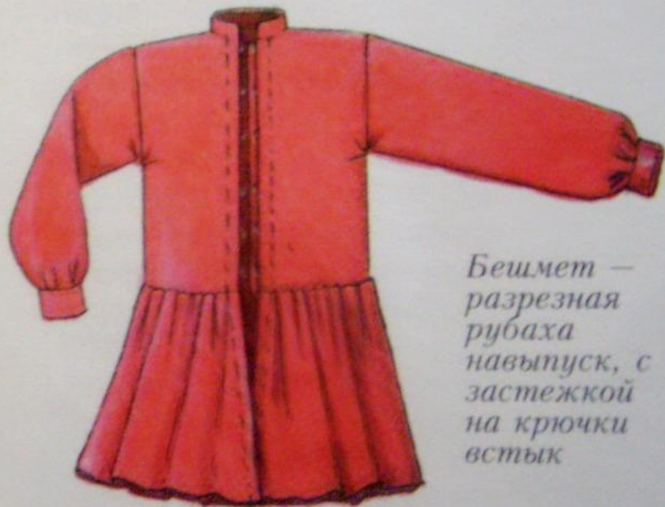
Бешмет — разрезная рубаша навыпуск, с застежкой на крючки встык