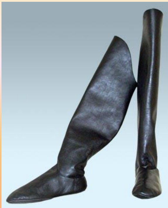
Ичиги – кожаные высокие сапоги без каблуков