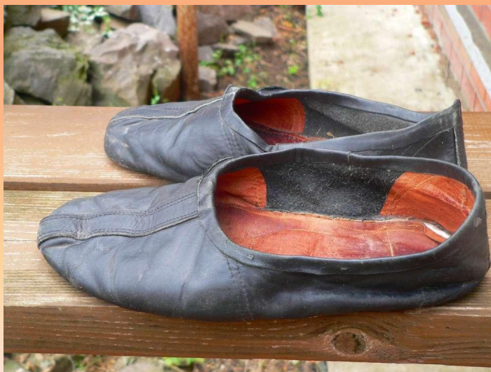
Чирики – туфли-галoши, которые надевали поверх ичиг