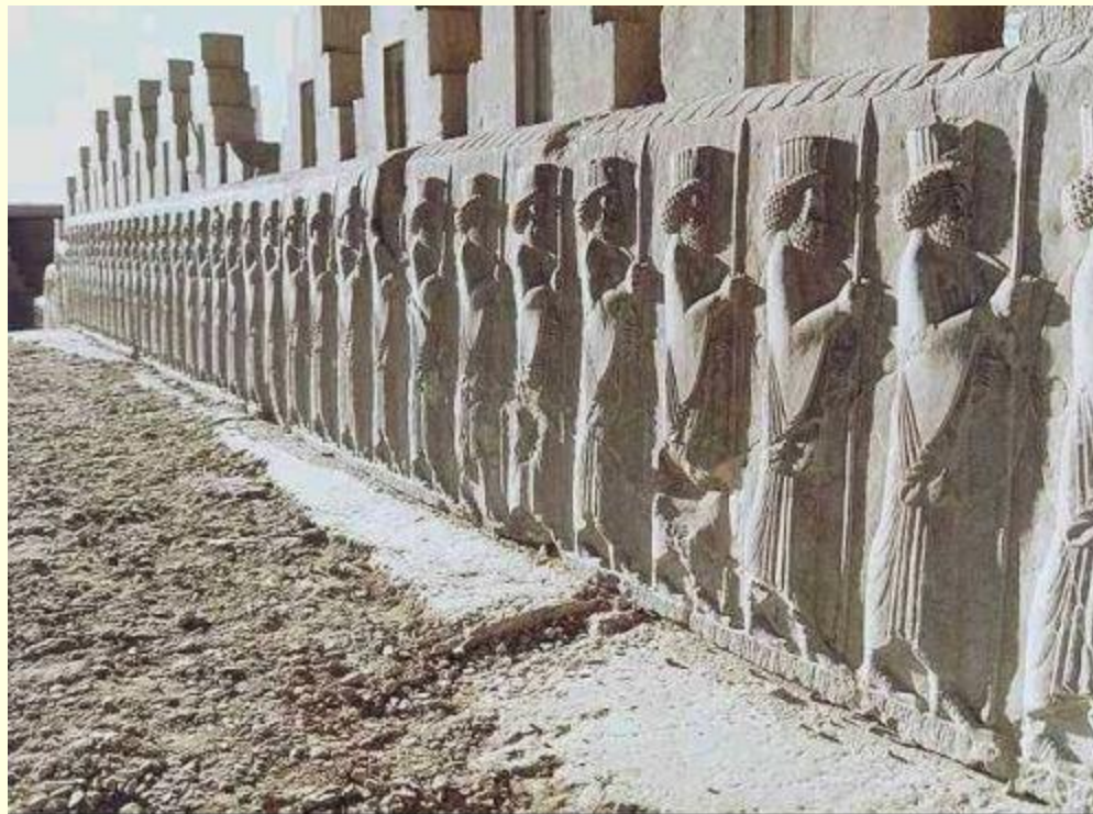
Персидские воины. Рельеф дворца Трипильон в Персеполе