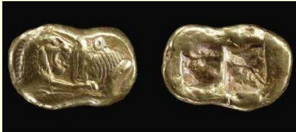
Лидийские монеты с клеймом, удостоверяющем вес. 6 в. до н. э.

В 7 в до н э здесь начали чеканить монету из сплава золота с серебром