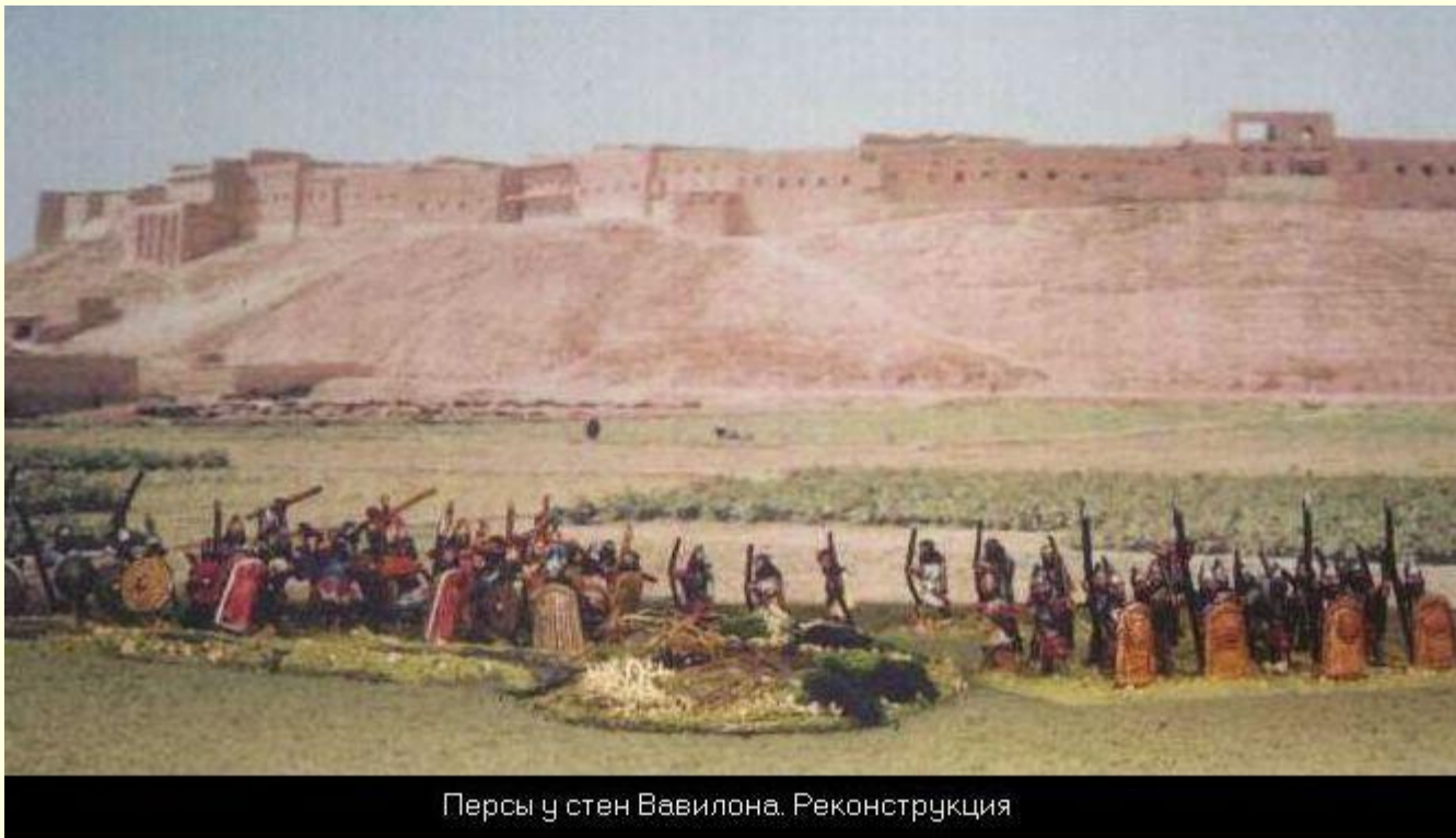
Персы у стен Вавилона. Реконструкция