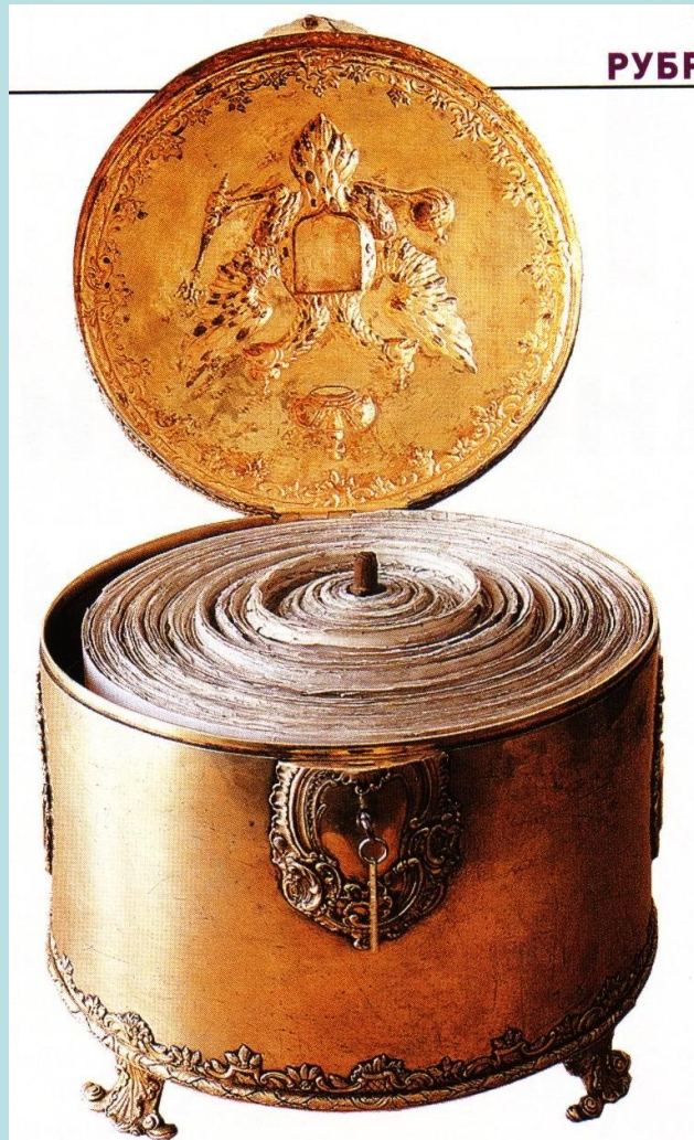
Соборное уложение в Ковчеге (текст — 1649 г., ковчег — 1767 г.)