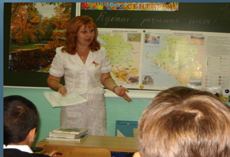
Рассказ, просмотр фильмов