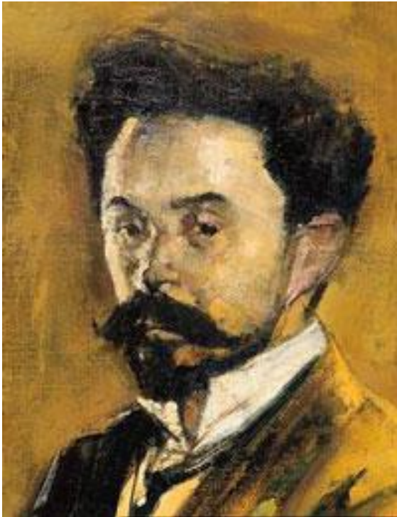
Александр Николаевич Скрябин