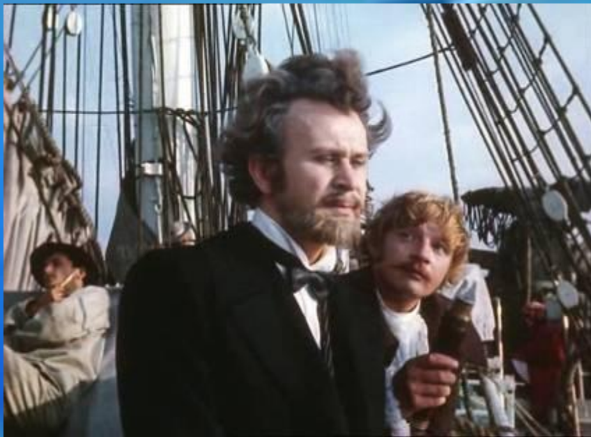
Профессор Аронакс и его слуга Консель