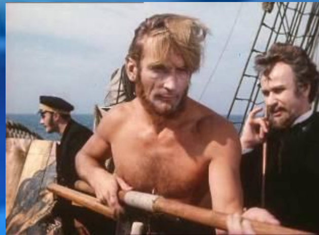
Гарпунер Нед Ленд