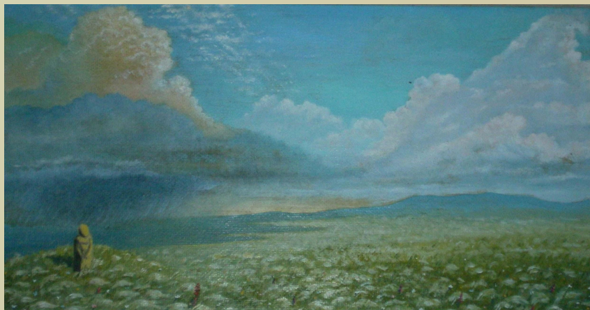
Фотографии картин В. П. Заикина