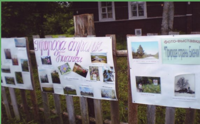
Наши работы на выставке