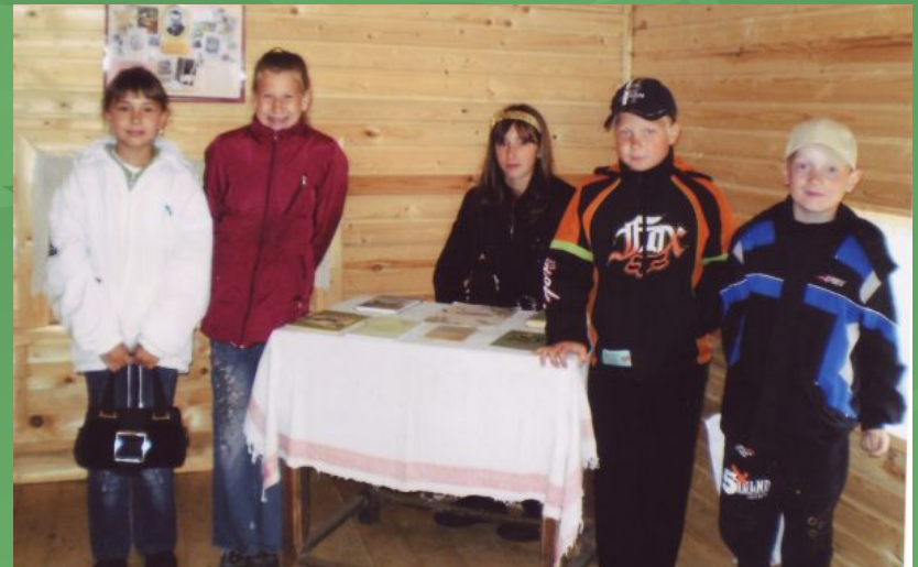
В доме писателя. 2009 г