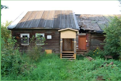
Дом писателя в д.Михеево