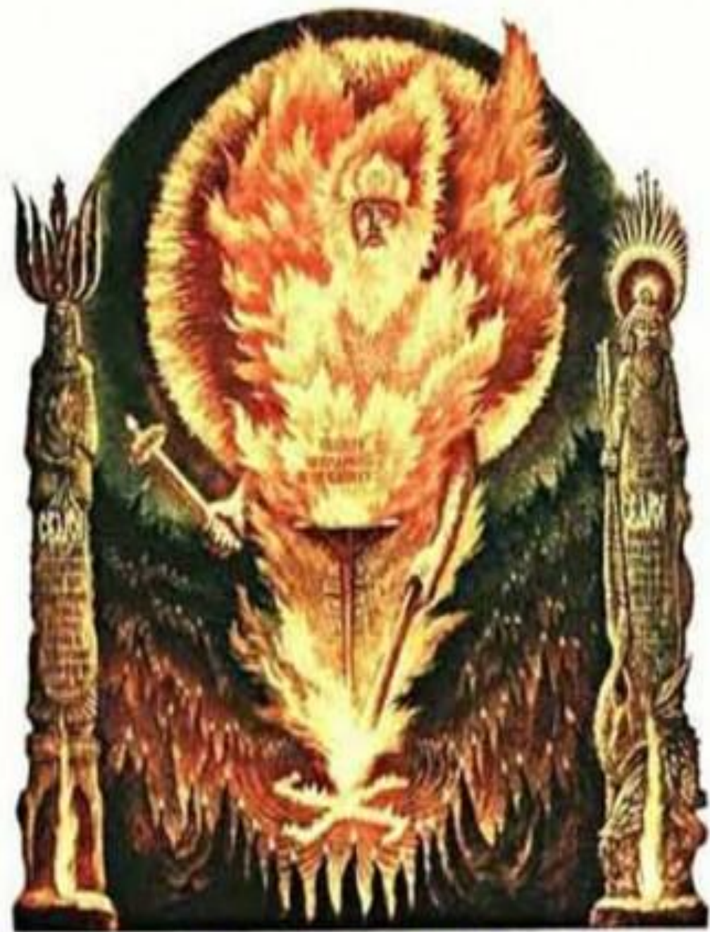
КОРЕНЬ ПРИБЛИЖИТЕЛИ, КОМУ ОТРУБЛАСЯ, И КОБАЧИТВО ЕГО УРАЖАНИЕ

Ярило — бог зерна, умирающего в земле, чтобы возродиться колосом, — был одновременно и прекрасным, и жестоким. Язычникам он представлялся юношей на белом коне, в белой одежде, в венке из полевых цветов, со снопом ржи в одной руке и отрубленной человеческой головой — в другой. Корень его имени — «яр» — встречается в словах, связанных с идеей плодородия и расцвета ЖИЗНИ: яровая пшеница; ярочка — молодая овца; но тот же корень означает гнев, пыл: яростный, ярый — сердитый или пылкий; яркий огонь. Яриле как богу смерти и воскресения приносилась в жертву молодая овца, кровью которой окропляли пашню, дабы сделать урожай более обильным.