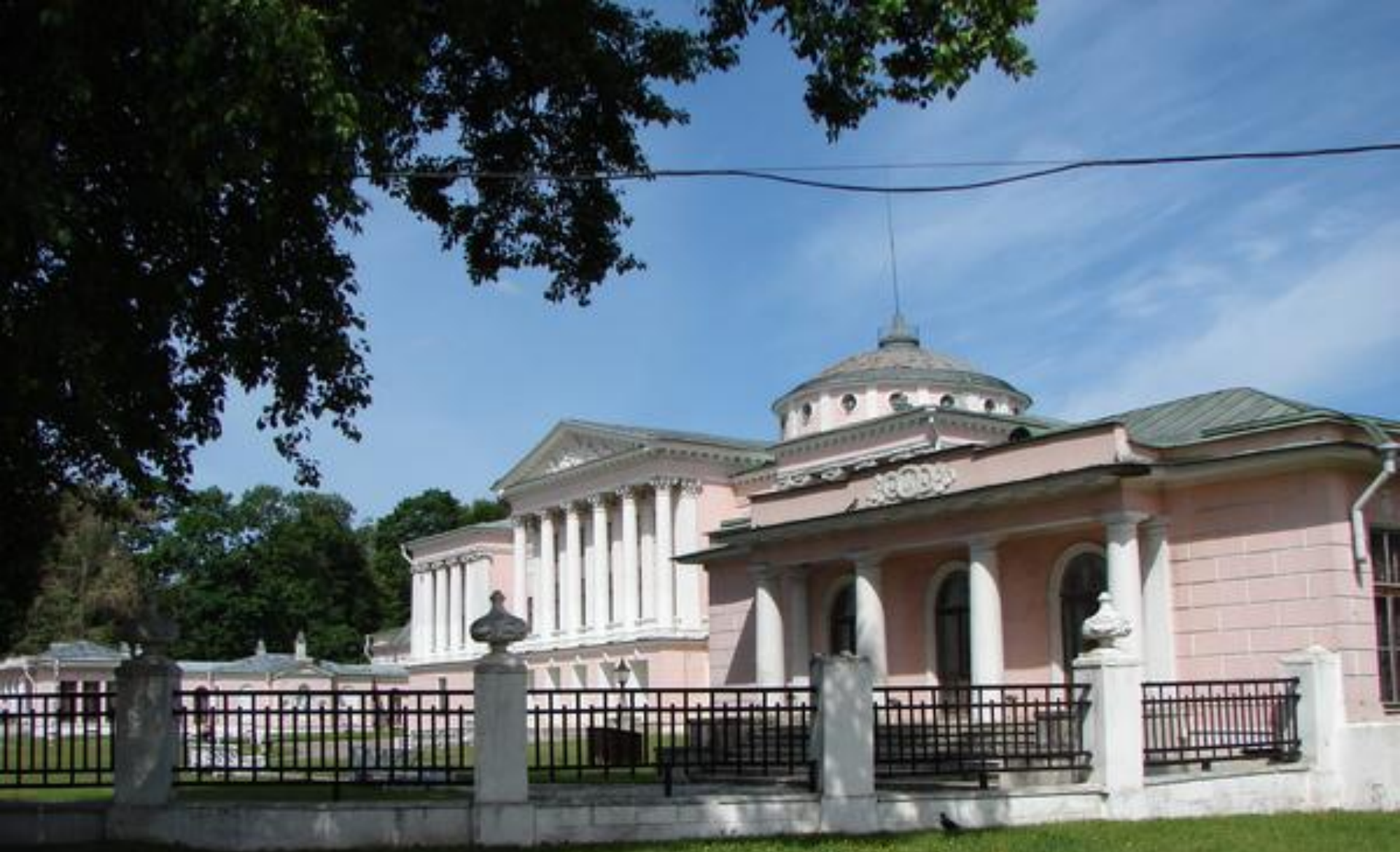
Музей – усадьба Останкино