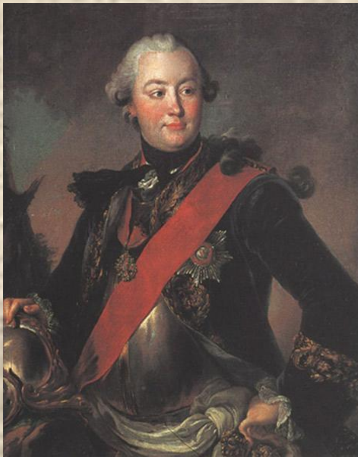
Ф.С.Рокотов. Портрет графа Г.Г.Орлова в латах