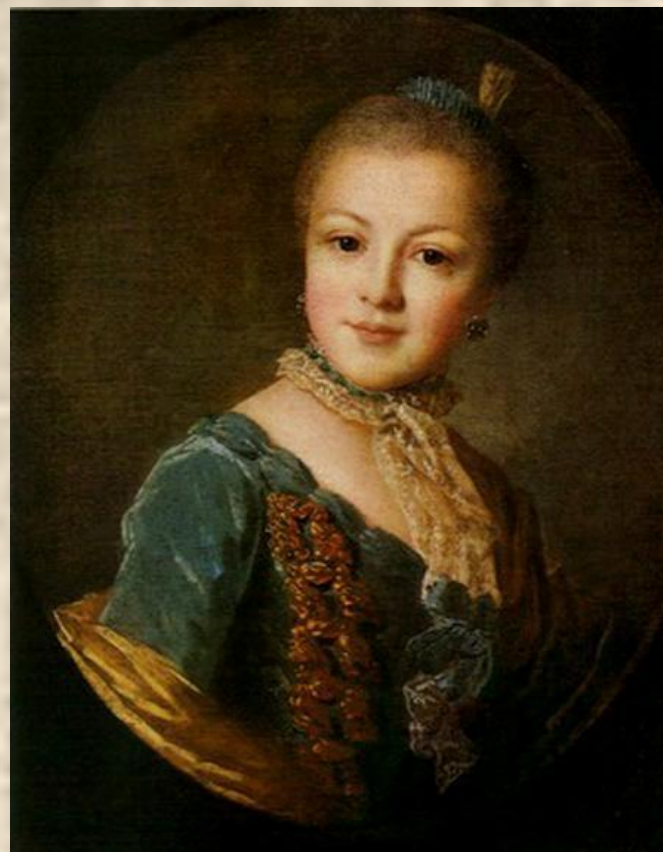
Ф.С.Рокотов. Портрет княжны Е.Б.Юсуповой