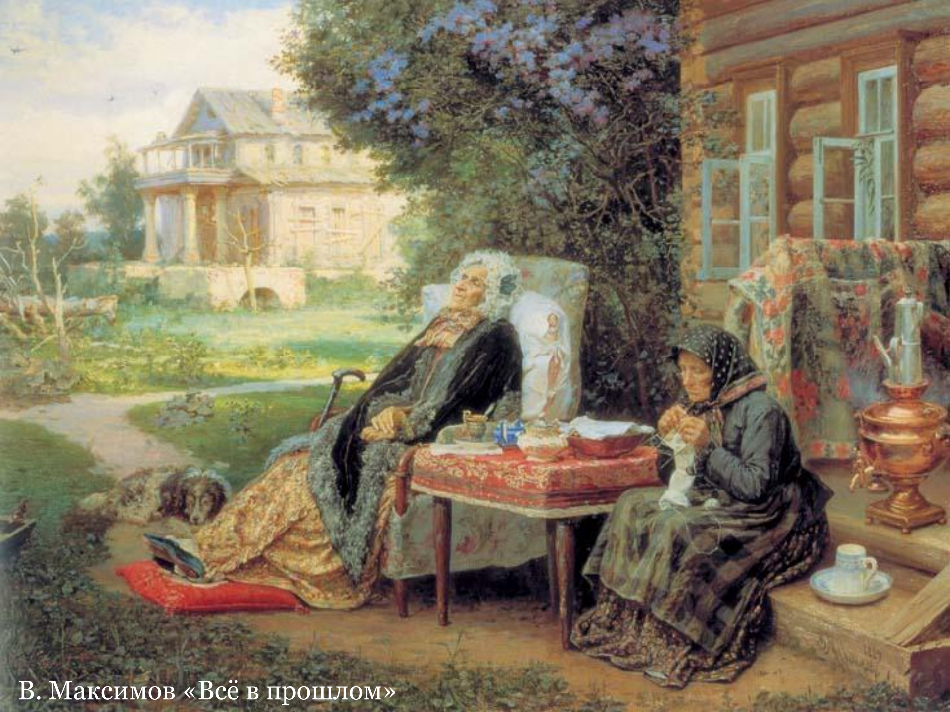
В. Максимов «Всё в прошлом»