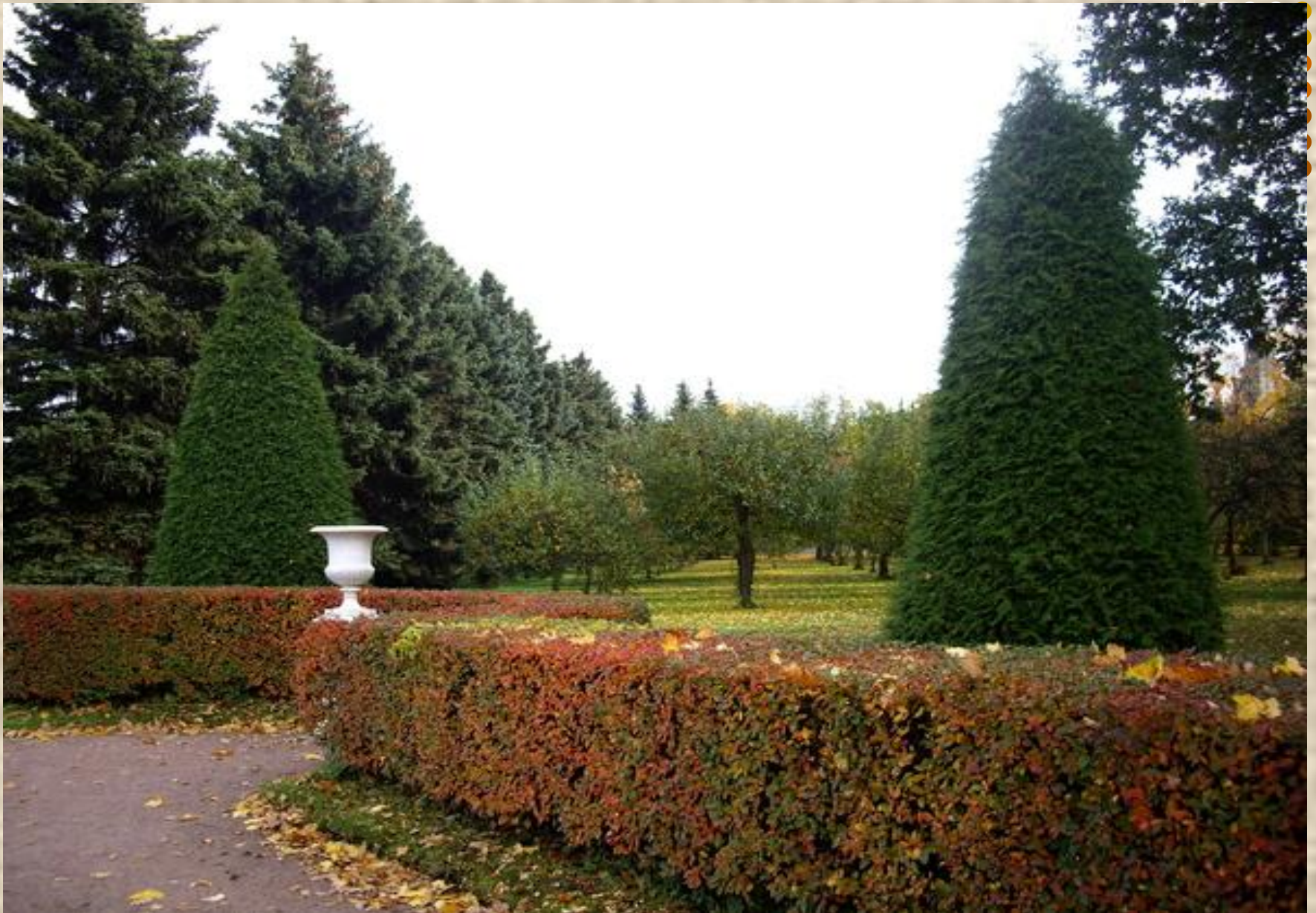
Петергоф. Верхний парк