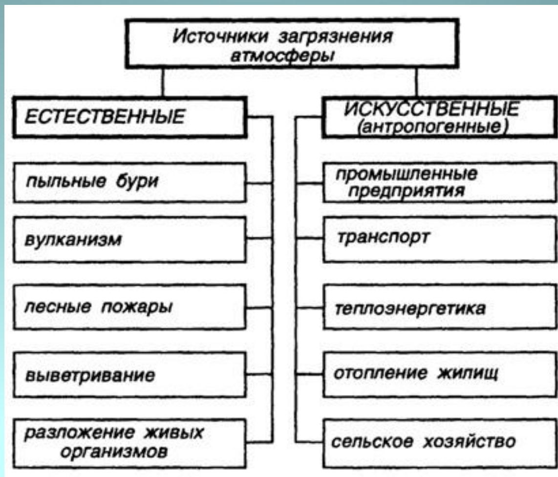
Рис. 1. Источники загрязнения атмосферы