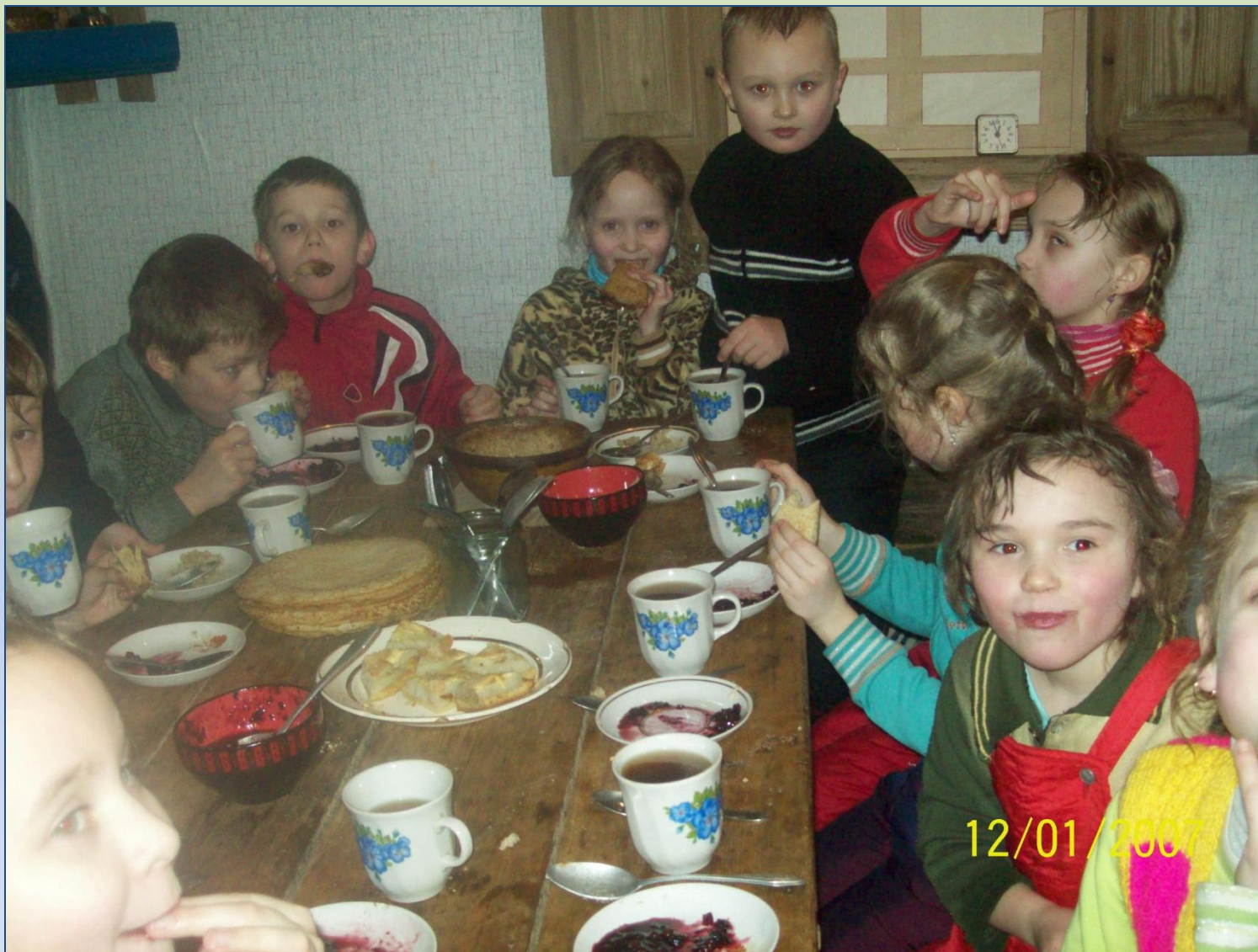
В деревенской избе в д. Валдеево После катания с горы. Каша уже съедена!