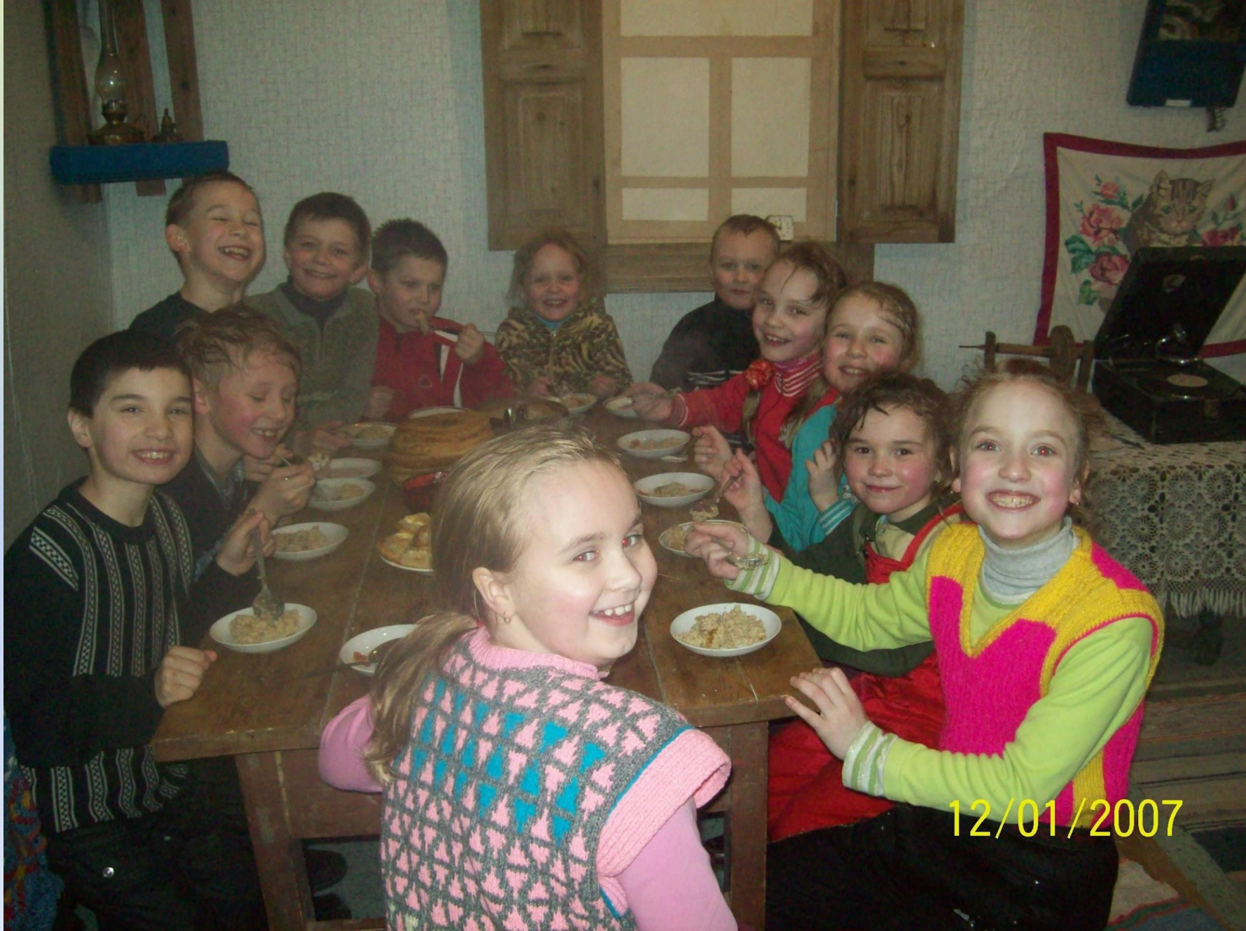
Вкусна каша из русской