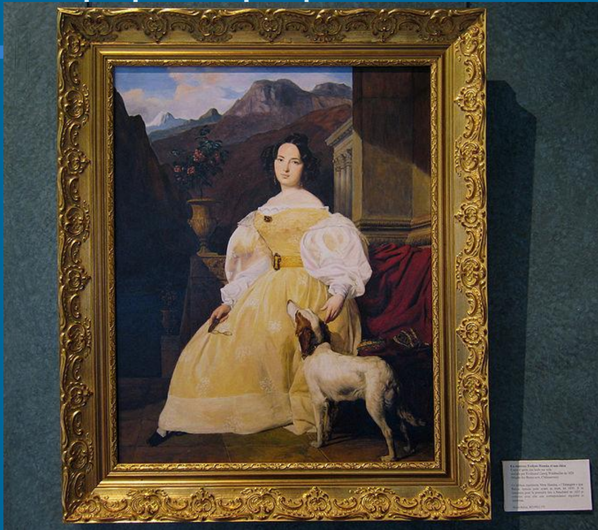
«Графиня Ганская в желтом платье» Портрет графини Ганской в желтом платье с белыми кружевами и белым воротником 1819 г. Холст, масло. Коллекция Государственного Эрмитажа Музей-заповедник «Петергоф» «Графиня Ганская в желтом платье» Портрет графини Ганской в желтом платье с белыми кружевами и белым воротником 1819 г. Холст, масло. Коллекция Государственного Эрмитажа Музей-заповедник «Петергоф»