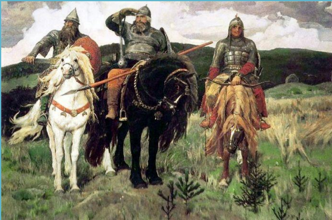
В.М.Васнецов «Три богатыря»

Вышли «Богатыри» посмотреть, «не обижают ли кого где».