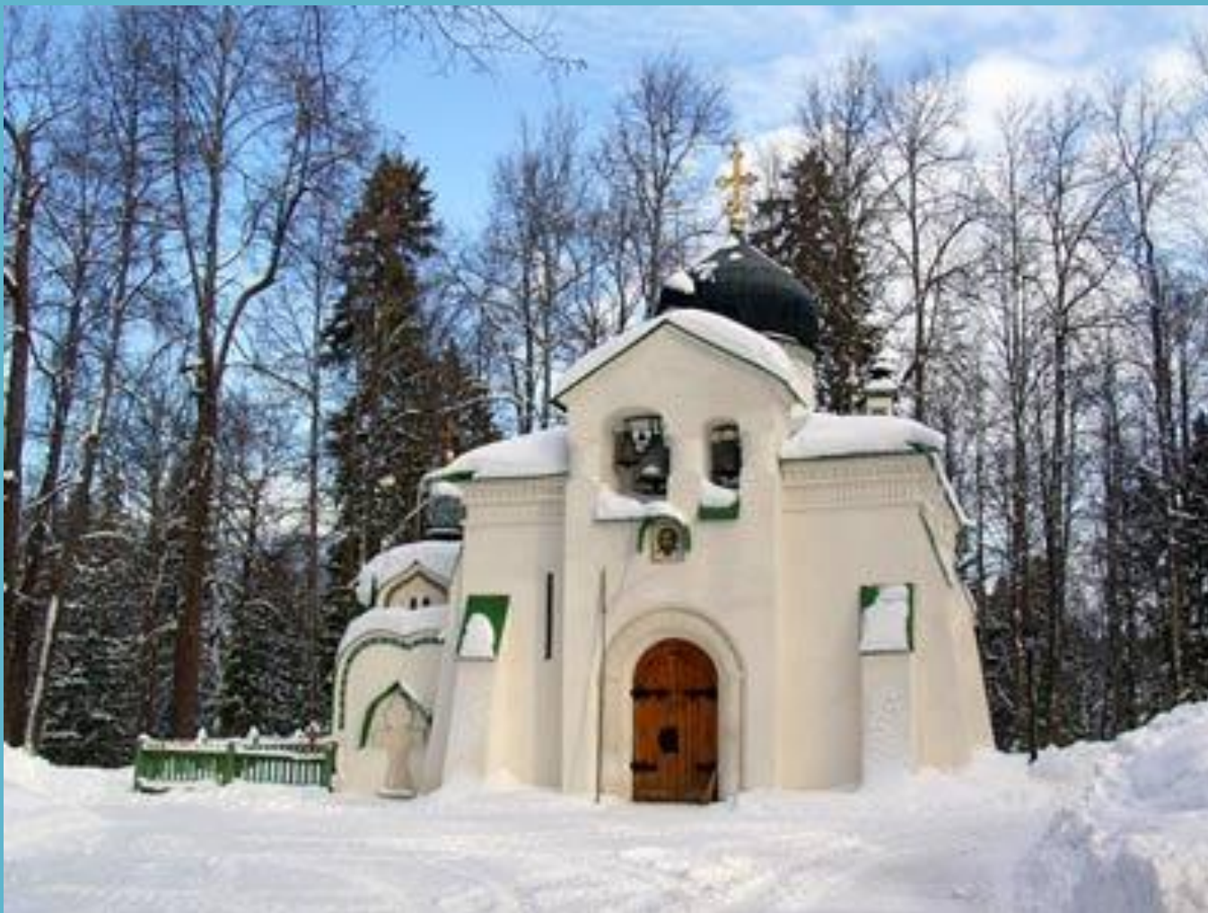
Абрамцево. Церковь Спаса Нерукотворного. Проект В.Васнецова и В.Поленова