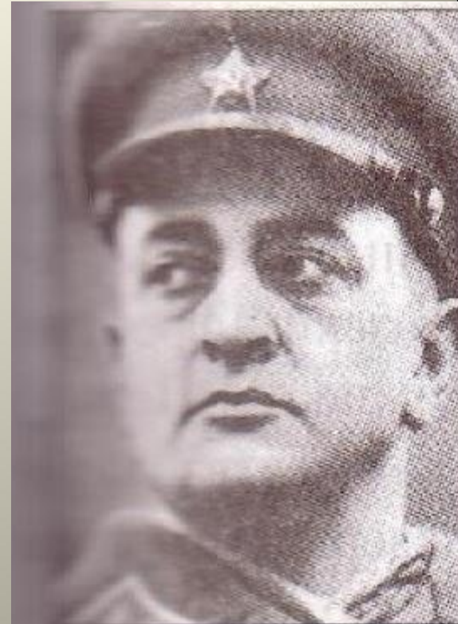
М. Н. Тухачевский