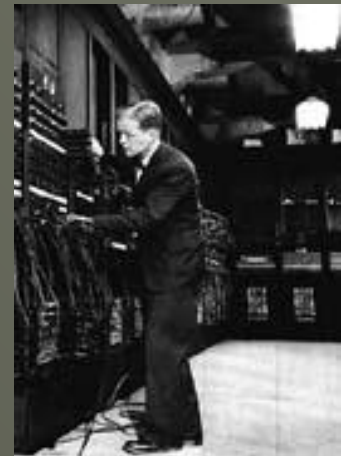
Компьютер "Эниак" Первое поколение

В основе работы ЭВМ первого поколения лежали электронные лампы. Примером ЭВМ первого поколения служит компьютер «Эниак».