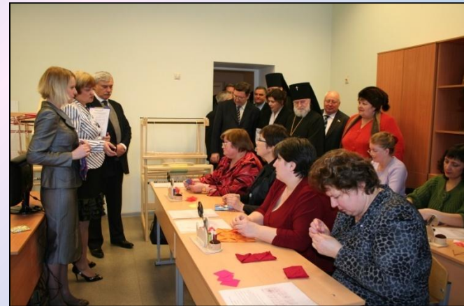
В настоящее время в здании располагаются мастерские отделения Православной педагогики Тамбовского педагогического колледжа