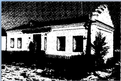
Бывший монастырский склад 1878-1918 гг