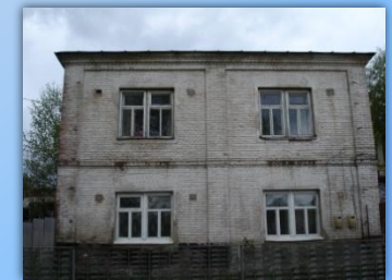
Здание в настоящее время