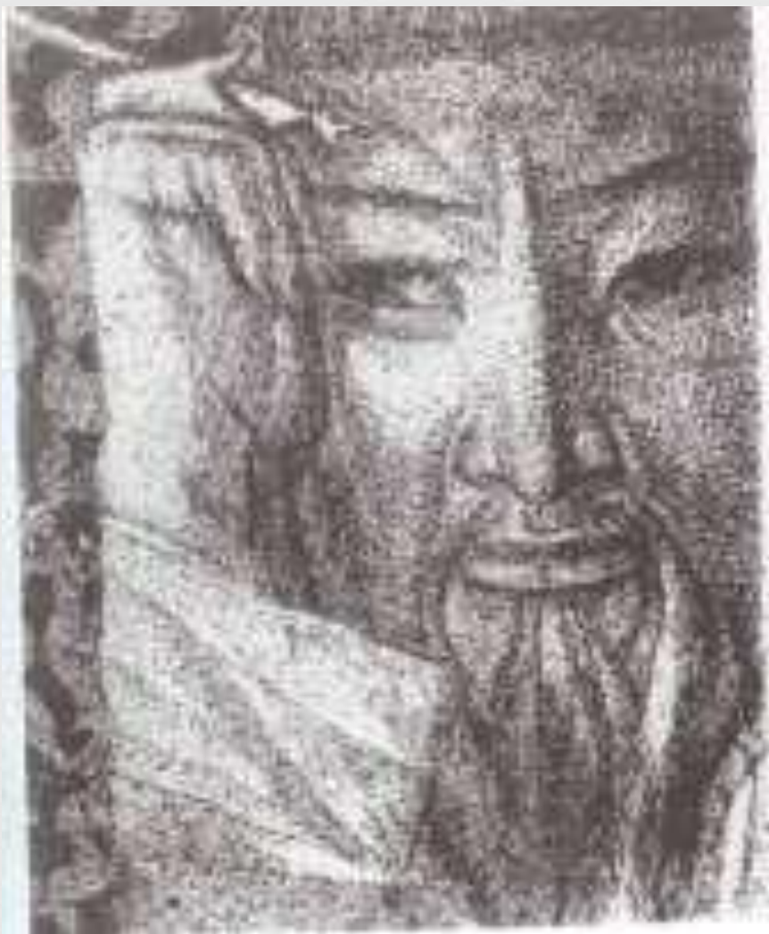
Иллюстрация к роману М. Ауезова «Путь Абая»