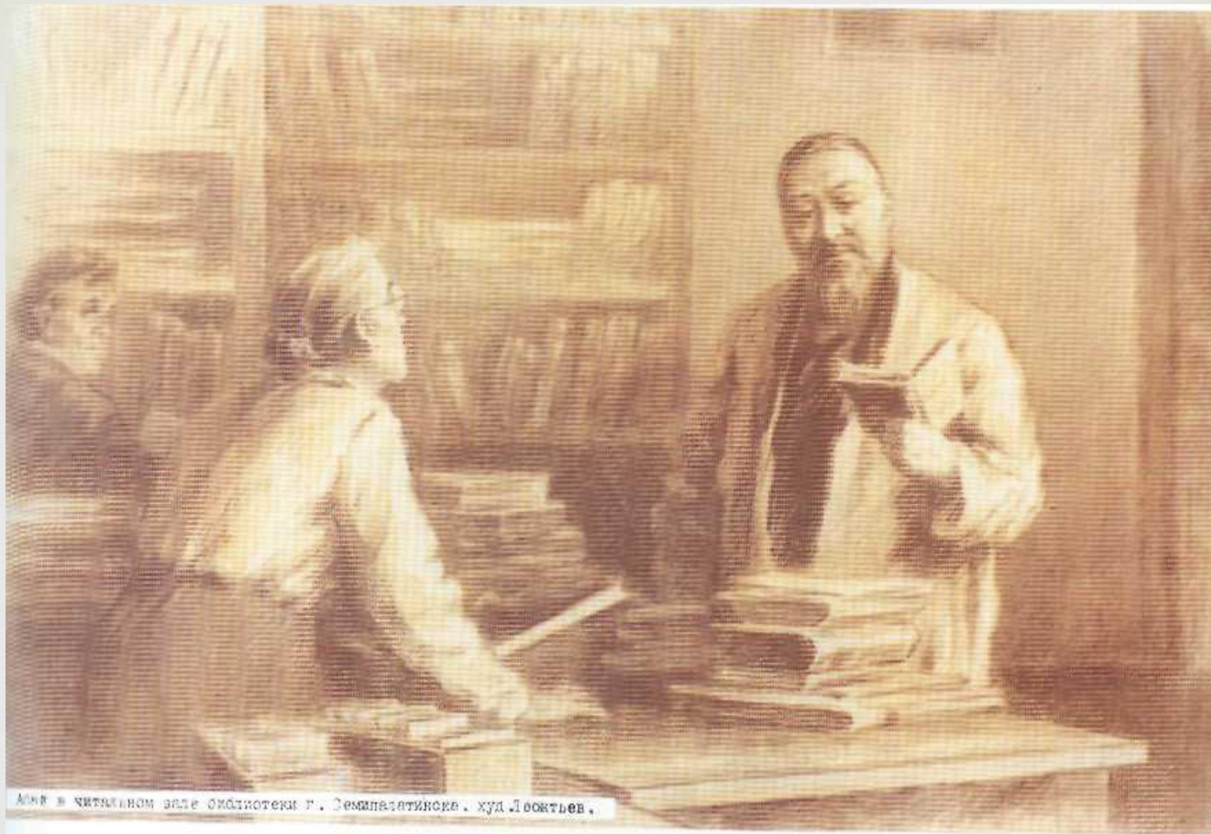
Абай в читальном зале библиотеки г. Семипалатинске. худ. Лоскутьев.

Абай Кунанбаев в Семипалатинской библиотеке