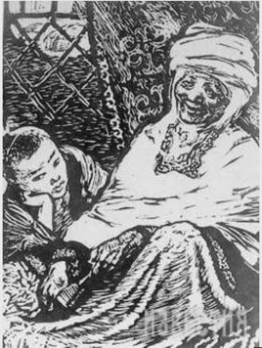
Абай с бабушкой Зере