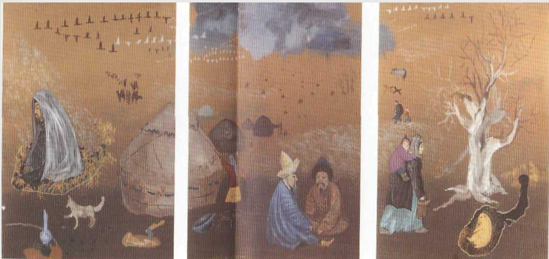
Иллюстрация к произведению «Осень»