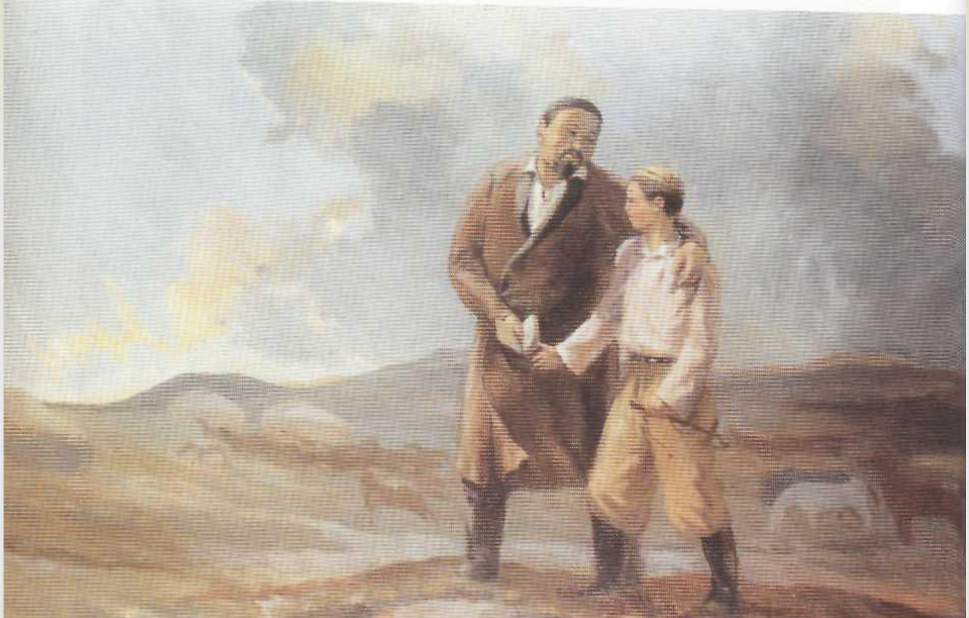
Абай и его сын Магауия