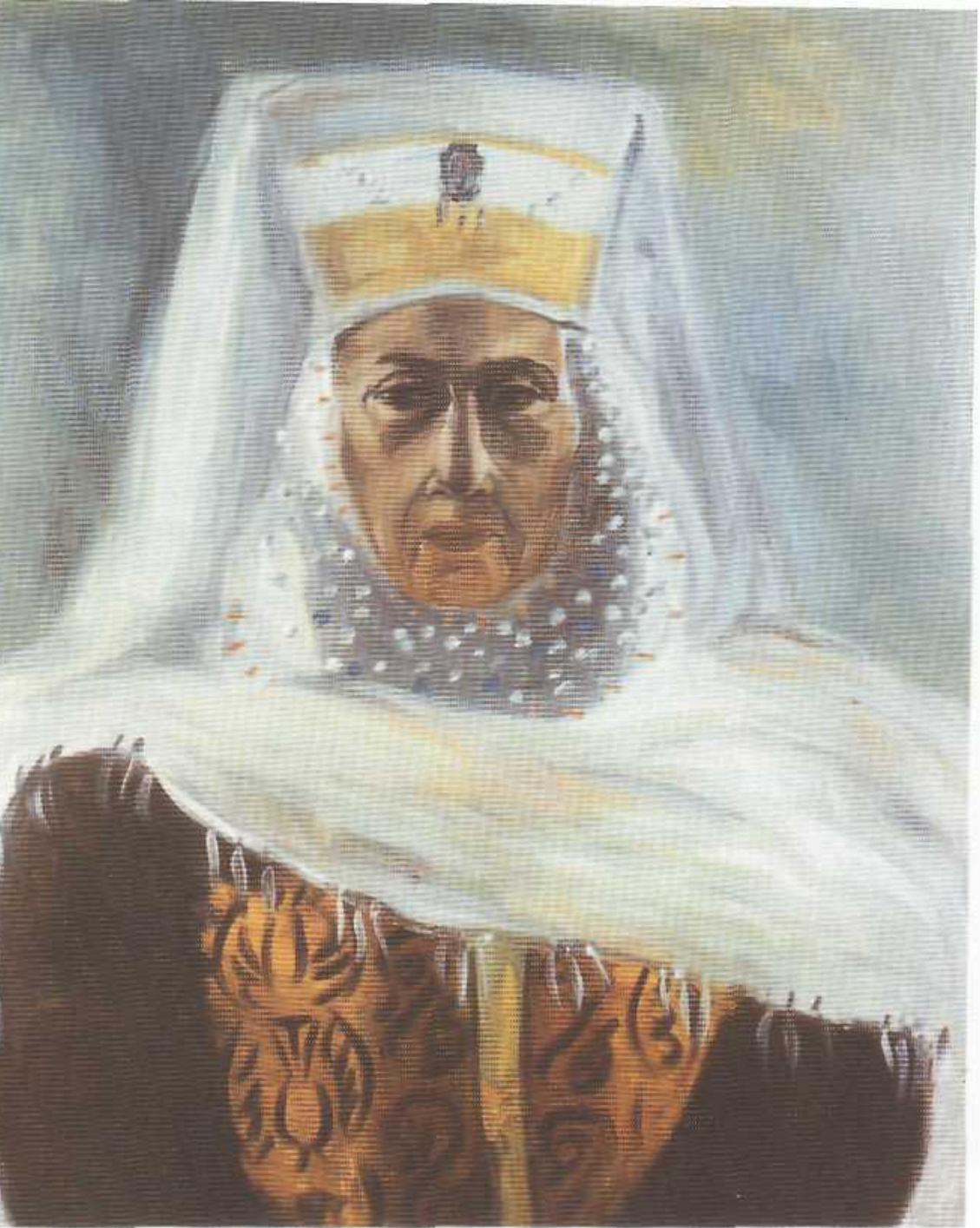
Мать Абая - Улжан