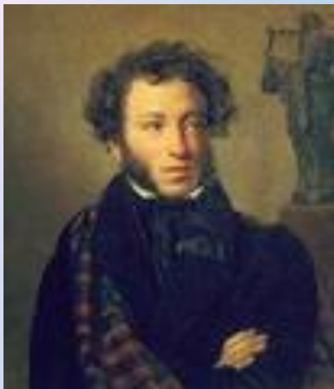
А.С. Пушкин – 37 лет