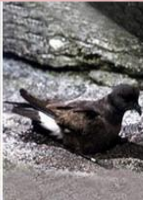
странствующий альбатрос, серый буревестник, глупыш, прямохвостая качурка.