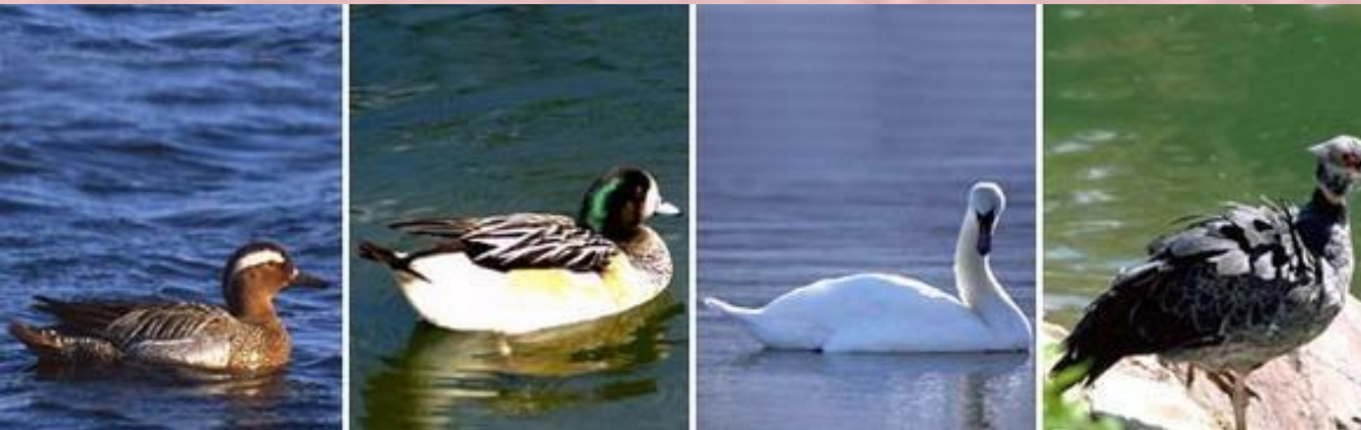
чирок-трескунок, морская чернеть, лебедь-шипун, хохлатая паламедея

. Около 150 видов по всему миру. Гуси и утки разводятся в сельском хозяйстве (употребляется в пищу мясо).