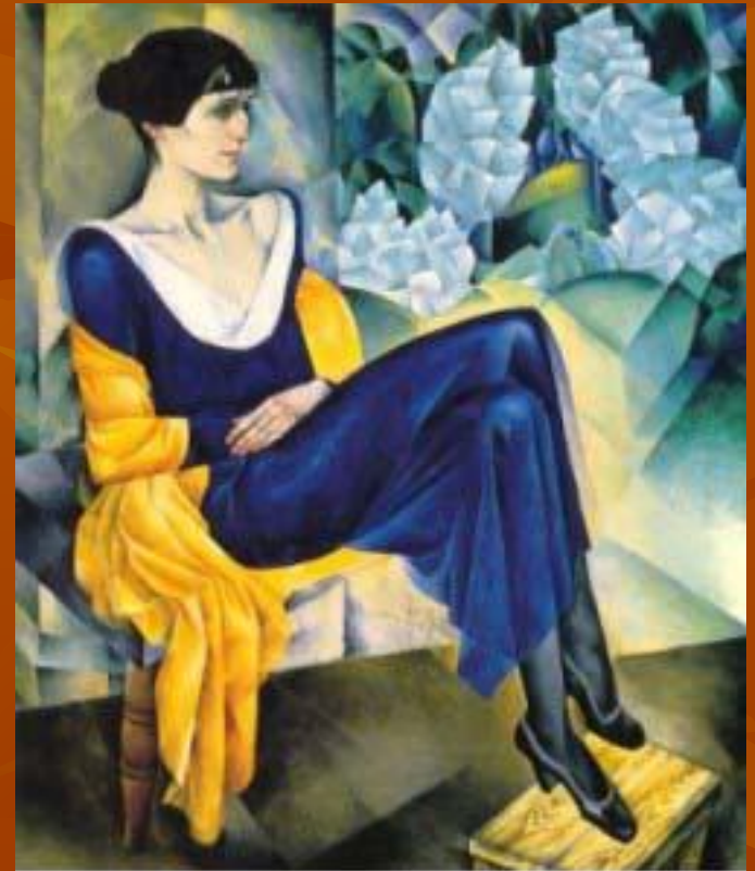
Nathan Altman Ritratto di Anna Achmatova 1914

Ахматова была самой поэзией, высшим и чистейшим её воплощением».