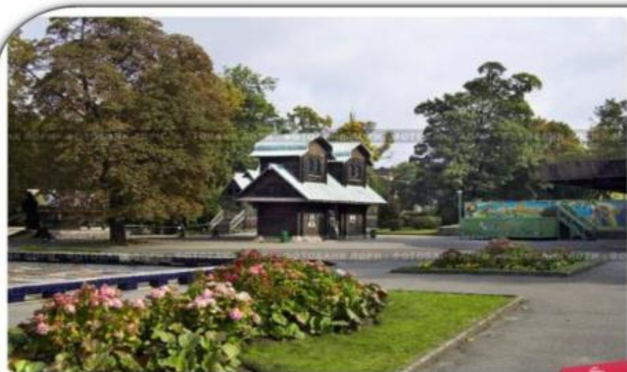
Калининградский зоопарк. Теремок

Один из самых больших и старых зоопарков России. Зоопарк был открыт в 1896 году.