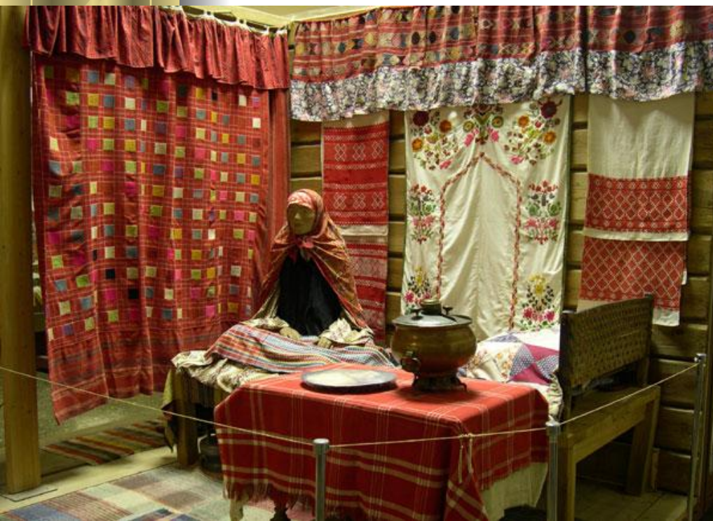
Женская половина дома