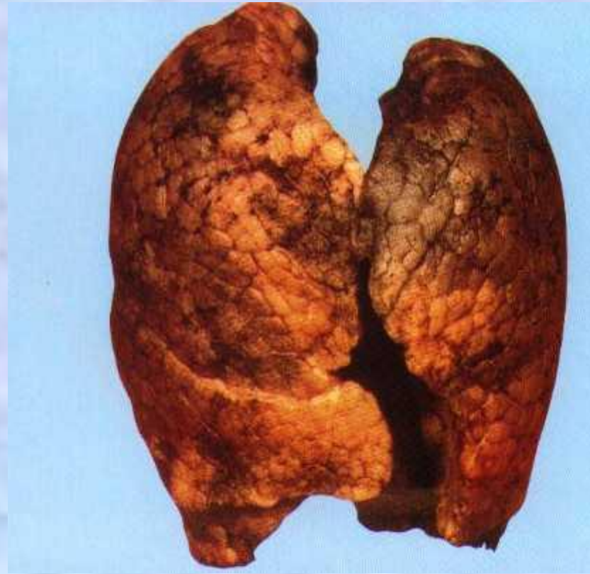
Лёгкие курящего человека