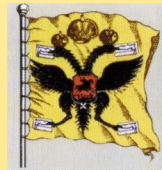
Рисунок судового царского штандарта. ок. 1700 г.