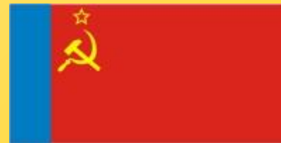
Рисунок флага РСФСР образца 1954 г.