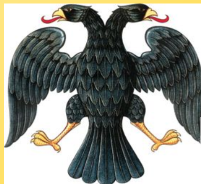
Герб России при Временном правительстве