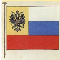
Рисунок флага, высочайше разрешенного к употреблению в частном быту 1914 г.