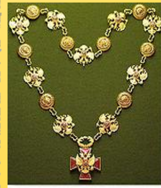
«Полезь, честь и слава»