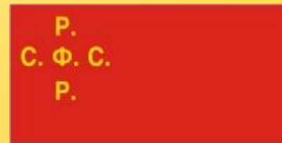
Рисунок первого флага РСФСР