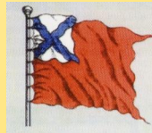
Рисунок флага арьергарда с 1700 г.