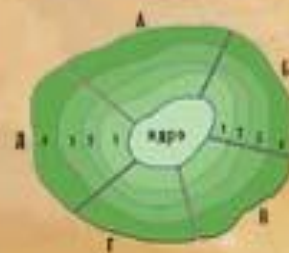
РАЙОНИРОВАНИЕ "СНИЗУ" (УЗЛОВОЕ)