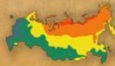
СТЕПЕНЬ БЛАГОПРИ- ЯТНОСТИ ПРИРОДНЫХ УСЛОВИЙ ЖИЗНИ НАСЕЛЕНИЯ