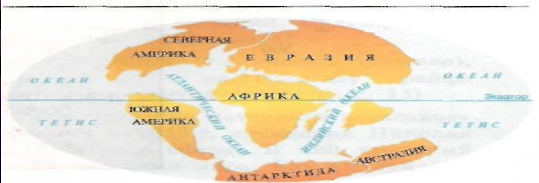
Рис. 4. Поверхность Земли 65 млн лет назад