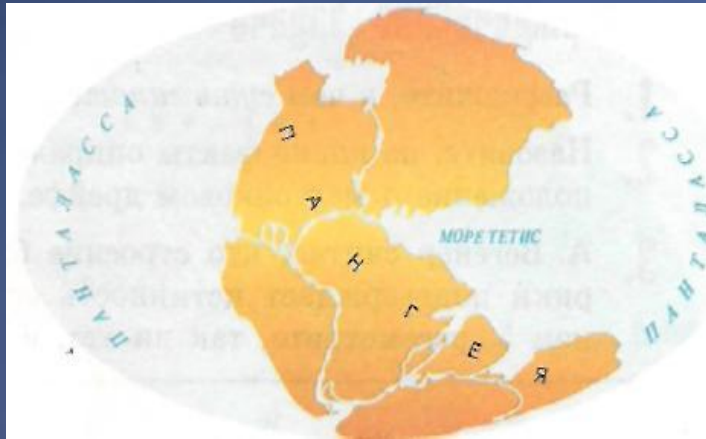
Рис. 2. Поверхность Земли 200 млн лет назад. Названия Пангея и Панталасса происходят от греческих pan — «вся», ge — «земля», talas-sa — «море». Название Тетис — от имени греческой богини моря Thetis