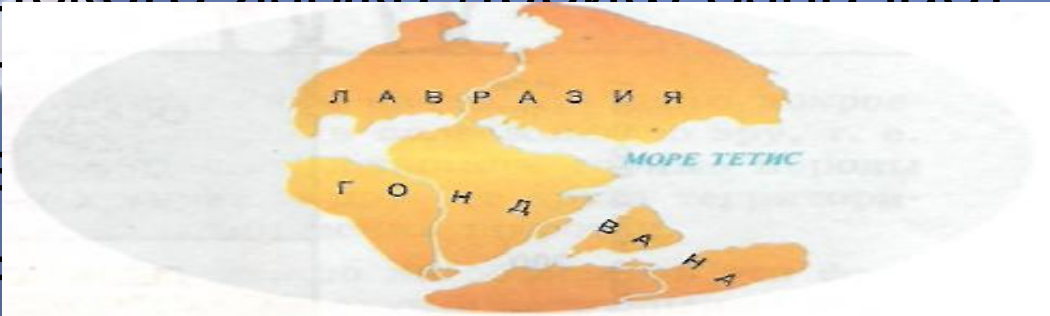
Рис. 3. Поверхность Земли 180 млн лет назад