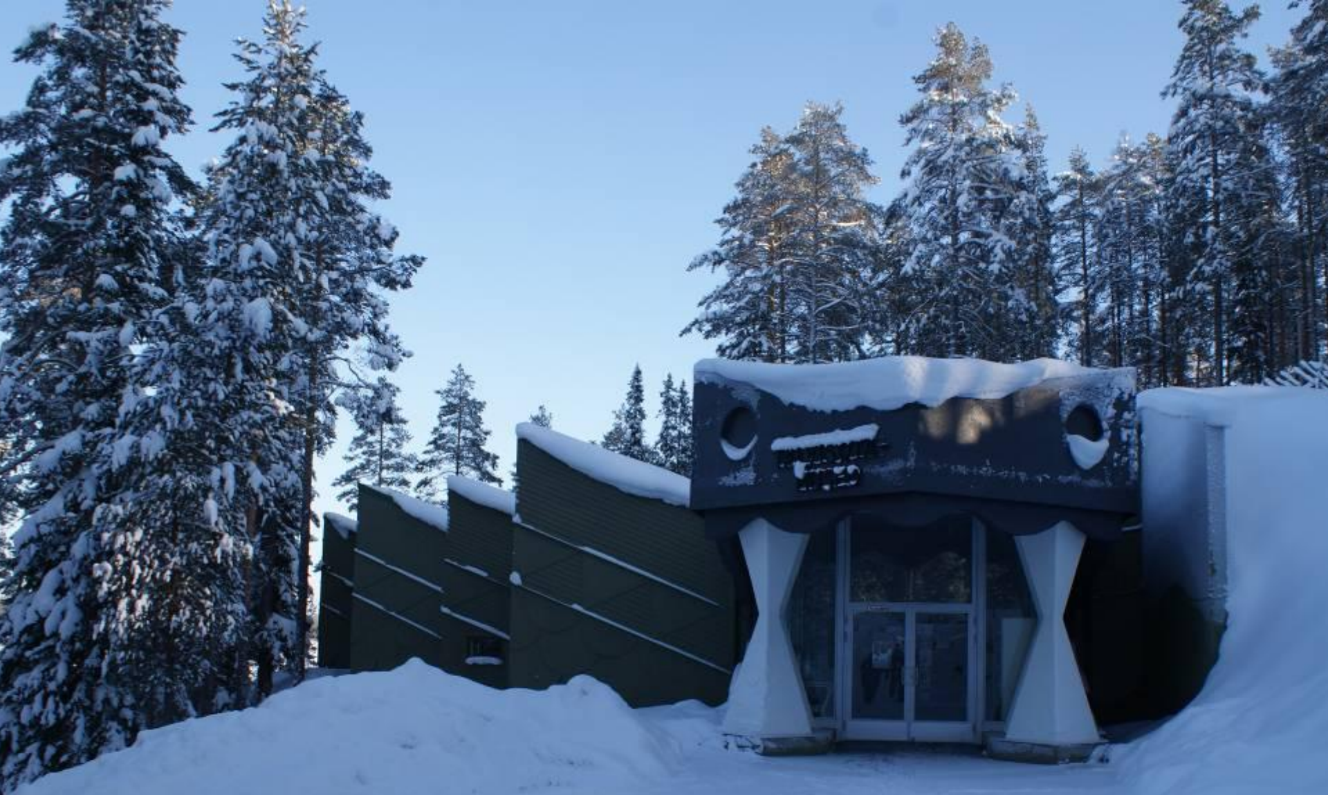
Мемориал, посвященный Финской («Зимней») войне, неподалеку от границы с Россией